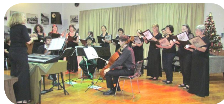
Tradicional canciones de Navidad, por Coral Hungaria