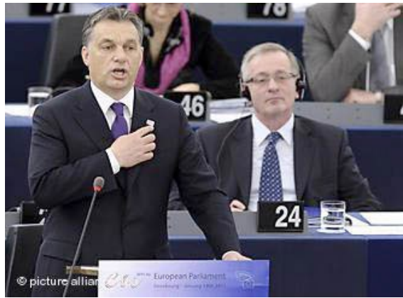
El Primer Ministro húngaro habla en el Parlamento Europeo

“Ahora es especialmente importante para nosotros saber que tenemos amigos en todo el mundo que nos sostienen en el esfuerzo de defensa de la Constitución frente a quienes cuestionan el derecho del pueblo húngaro (de los pueblos húngaros) para definir libremente los principios fundamentales de su vida pública. Por lo tanto, estamos muy agradecidos a las 67 entidades de la sociedad civil firmantes por haber expresado públicamente su apoyo. Las noticias sobre esta Declaración han sido ampliamente difundidas en Hungría”.