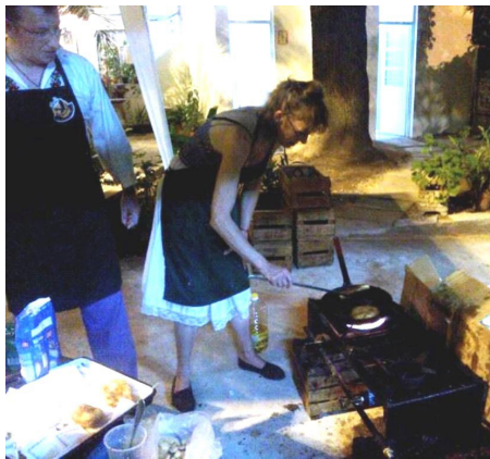
Szerző süti a „kolomp-lángost”

Közben szünet nélkül fogyott a regösök csapolt söre, a csalamádés virsli, a kolompok szem előtt sült sajtos-krémes fokhagymás lángosai és a natúr jeges narancslevei.