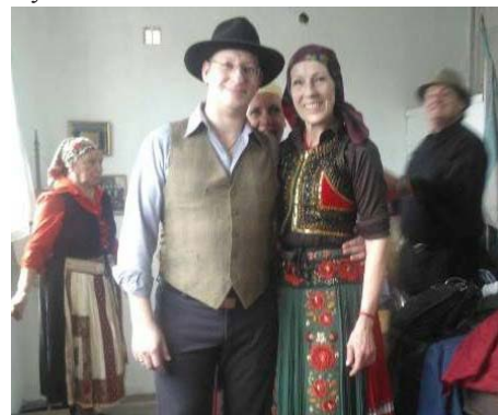
Szerző a táncosaival: