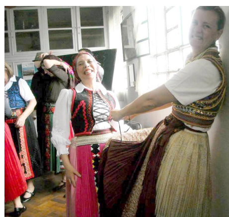
Szorosra a mellést?