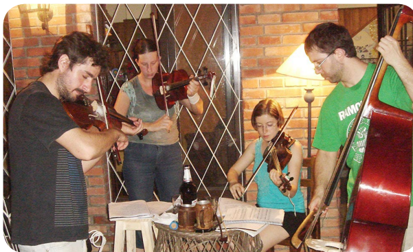
▼ CEFRE Bonapartian Edível