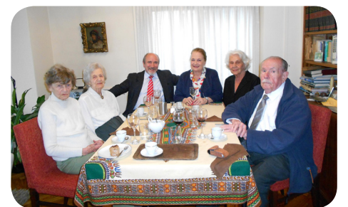
Szőnyi Ferenc az Aranykarika baráti körben

November 7-én Monostoryné Ildikó lakásában nagy örömmel találkoztunk Szőnyi Ferenc volt magyar nagykövettel, aki minden egyéb kötelezettsége mellett eljött meglátogatni az „Aranykarika” régi, hűséges barátaink körét. A Miféle Orpheusz c. dedikált verseskötetét hálásan köszönjük!