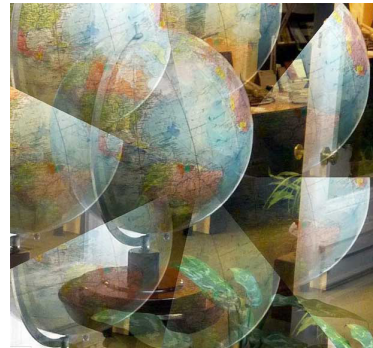
Az egész világot átfogó magyarság

„Az igazságot, a békét és a megértést mindig csak azok keresik a földön, akiket legyőztek és eltapostak”. Wass Albert