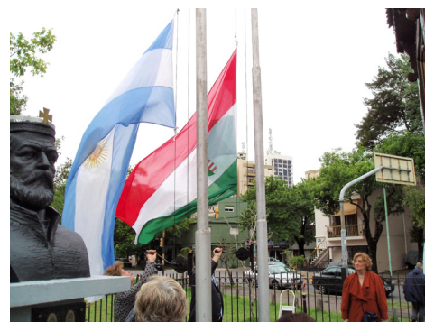
Szent István mellett lobog a két haza zászlaja

Sokan vannak ma is, akik igyekeznek a kommunizmus időszakát úgy beállítani, mint egy szükségszerű, a körülményekhez képest elfogadható rendszert, az 56-os szabadságharcot pedig a kommunizmus megreformálására tett kísérletként. Az igazság azonban az, hogy az 56-os szabadságharc nem reformkísérlet volt, hanem a magyar nép nagyszerű összefogása a mindenhol nyomort és pusztulást hozó kommunista diktatúra és a szovjet megszállás ellen.