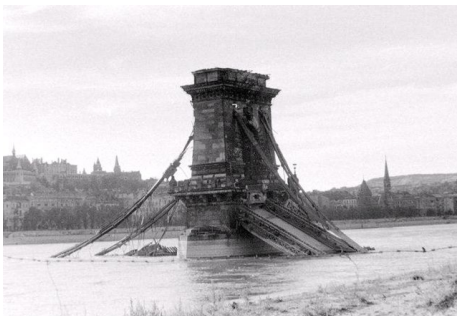
A hídnélküli Budapest 1945-ben: ▲

Karácsonyfánkat nem tudjuk leszedni. Senki sem törődik vele. Mikor az oroszok davaj, davaj kiáltásaikkal elfoglalják a pincét, majd a németek lángszóróval visszatérnek, minden égni kezd. A tűz martaléka lesz az egész ház. Elpusztulnak a bútoraink, a növényeink. Szegény kis Mackó kutyánkat sem látjuk viszont többé. Félelmében bebújt valahová, és megfulladt a füstben. Egy szál ruhában kezdjük újra 1945 tavaszán az életet, s örülhetünk, hogy ép bőrrel megúsztuk. A háztömb hetekig ég.