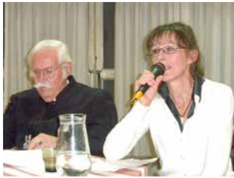
A két előadó

közönség ez esetben nyilván vonzódik a megadott témához, így hát az arcon, a nézéseken kezdettől mély érdeklődést vesznek észre. Művészbáratommal olyan közös előadásra készültünk, amely eredetileg két külön témakörnek indult. Az egyeztetés érdekes kihívás volt! Több kellemes beszélgetés-délutánig igényelt tőlünk.