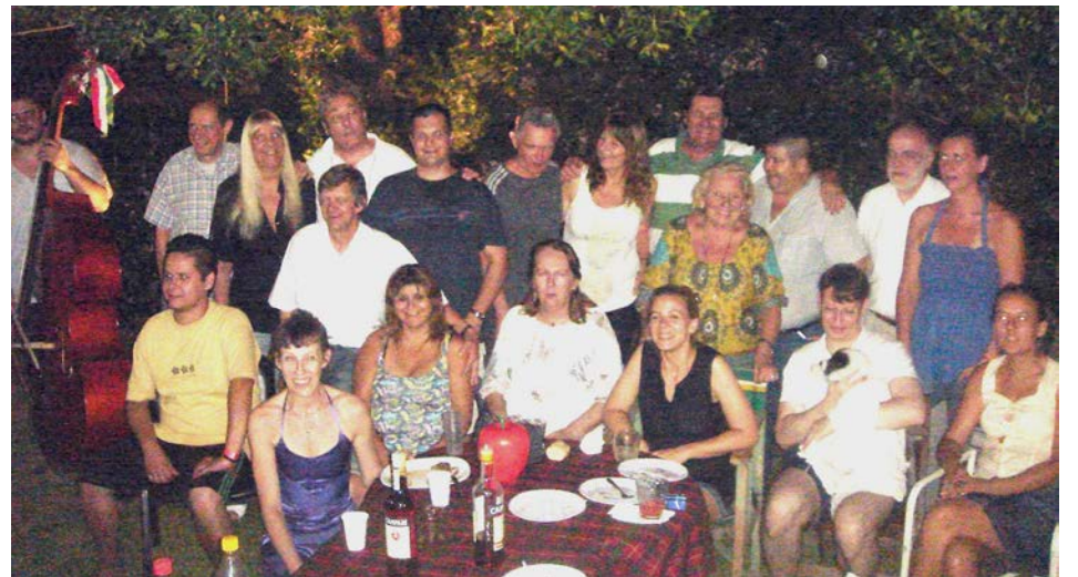
Nem mindenki fért rá a csoportképre...