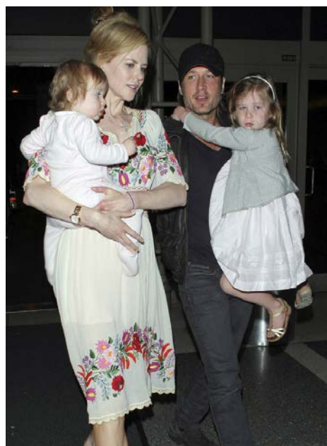
Nicole Kidman – Kalocsaiban!

Úgy látszik, tovább hódít a kalocsai minta. Jenson Button után Nicole Kidman vett fel ilyen ruhát, ráadásul ő nem is egy szavazás miatt, hanem azért, mert tetszik neki. Los Angelesben, a reptéren kapták le a fotósok épp egy éve, tavaly március 14-én, amint gyermekeivel és férjével kifelé tartott az épületből.