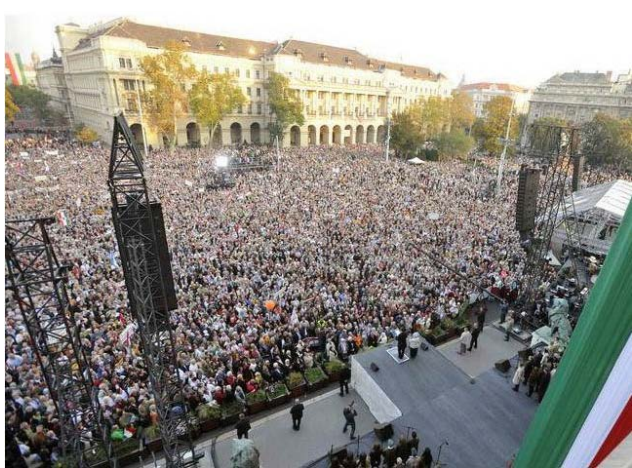
Culmina la marcha: discursos festivos en la plaza Kossuth

Cifras oficiales hablan de cerca de medio millón de participantes en la marcha. Considerando que la población total húngara apenas llega a 10 millones, ¡cada vigésimo ciudadano estaba allí!