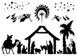
ÉRTÜNK SZÜLETETT KRISZTUS

Karácsonyozzunk boldogan és szeretetben családi körben!