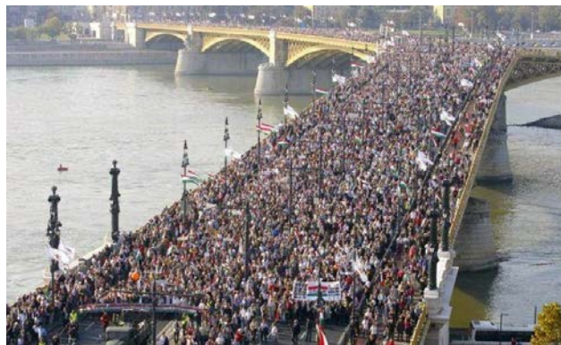
Desde la plaza Széna, en Buda, la multitud pacífica cruza el Danubio a Pest por el puente Margarita, para asegurarse un lugar en la plaza Kossuth, frente al Parlamento

Los 2/3 de mayoría en el Parlamento no se deben a engaño o fraude: se trata del fiel reflejo de la voluntad de la mayoría de los húngaros. (SKH)