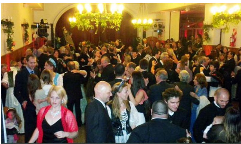
Hölgyeim és Uraim: Áll a bál!

Feltűnően sokan jöttek el! Elkelt az összes vacsorajegy, teltház volt! Öröm volt nézni a zsúfolt termeket, s még nagyobb boldogságot jelentett az emberek vidámsága, a pillanatig sem lankadó hangulat s főleg az, hogy megünnepeltek mindent, amit kaptak!