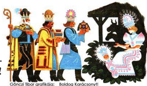
Gönczi Tibor grafikája: Boldog Karácsonyi!

Rakd el a HUFI minden számát úgy, hogy - mint kis „könyvecske” - a kezed ügyében legyen. A néprajz, néptánc, cserkészélet gyöngyszemeit gyűjtögetjük számodra!