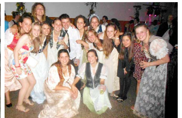
▲ Vidám fiatalság