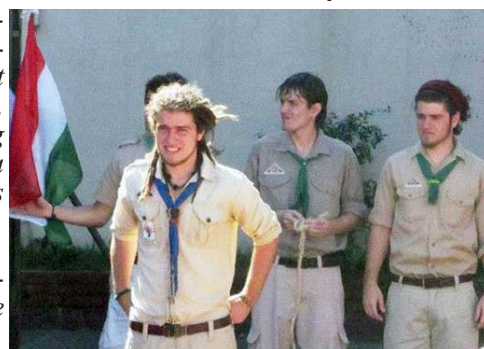
Immár új parancsnoka van a 18.sz. Bartók Béla csapatnak!

„Az embereket csak szeretve lehet jobba tenni” Böjte Csaba