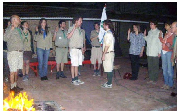
Ünnepélyes átadása a stafétabotnak...

H: Mit üzensz a csapatod tagjai szüleinek?