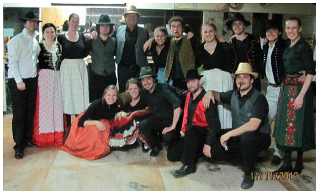
▲ A Mundrucban táncolók