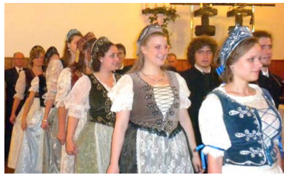
▲ A cserkész sorfal