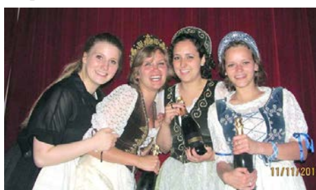
Nem kell ok a jókedvhez!