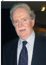
A magyar nagykövet

Magyar közösségünk hazafias és társadalmi rendezvényei ebben az évben mind október 10 és november 10 között zajlottak le. Dicséretreméltó buzgalommal mindegyiken igyekeztünk részt venni. Hideg szél, eső, vagy hóhullám ide-oda, a kolónia ünnepelt. Az 1956-os forradalomról megemlékeztünk a Hungária egyesületben, majd a Plaza Hungrián a székelykapunál, valamint a magyar nagykövetség rendezésében a Nemzeti Könyvtárban. Nagykövetségünk dr. Varga Koritár Pál és felesége magas tisztségüknek eleget téve a magyar kolónián kívül meghívták a magyar kolónián kívül meghívták a külképviseletet, a Club Europe és az argentin hatóságok vezetőit is. Hálásak vagyunk a főváros kormányának, amely a nagykövetség rendelkezésére bocsájtotta az óriási előadótermet és az ehhez csatolt helyiségeket, ahol százánál több vendéget kitűnő rendben és ellátással fogadhattak.