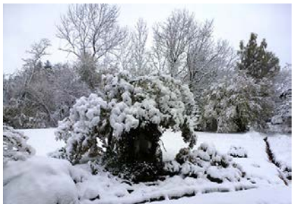
Az északi féltekén már havazott október végén!

Nyugtalan, borongós október után reménykedve meredünk az égbe. A szokatlanul hideg, esős tél az idén sokáig húzódott. Ennek az országnak egyik áldása, hogy az év 365 napjából közel háromezredében kislétezik a nap. Az idei tél ezt meghazudtolta. Viharok, jégeső, árvizek gyakran keserítették az egyébként is háborgó népet. Erre nem vagyunk berendezkedve. Az október végén jött orkányszerű vihar úgy elárasztotta Lujánt és környékét, hogy a lakosság napokig aludni a háztetőkre kellett menekülnie. A Luján-i katedrális pincéjében pedig, mondják, úsztak a koporsók. A föld északi feléből is furcsa klímaváltozásokat jelentettek. New Yorkot a Sandy tornádó ejtette kétségbe. Bajor falvakban pedig elcsodálkoztak, amikor október 29-én reggel a kertben hó fedte a bokrokat és a mezőt.