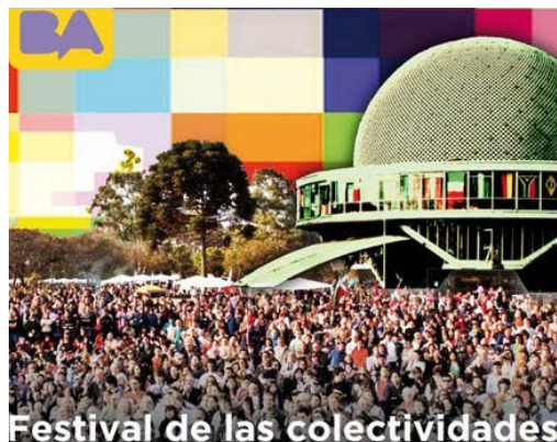
Festival de las colectividades