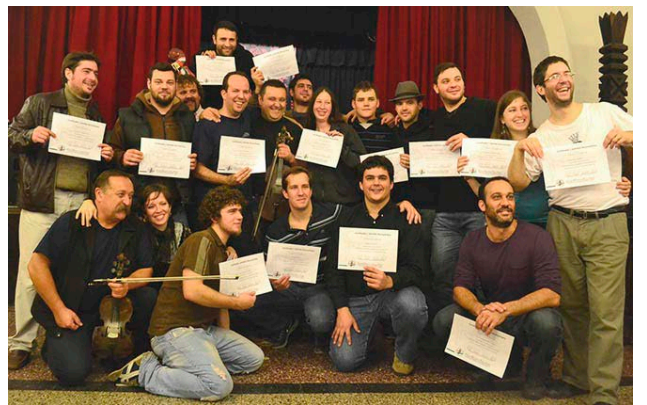
Az újdonsült zenészek oklevelet kaptak