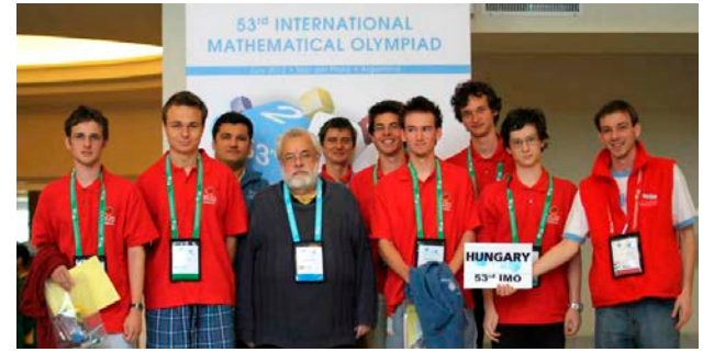
A magyar csapat. 100 országból 548 versenyző érkezett

Aki utoljára nevet, annak lassú a felfogása!