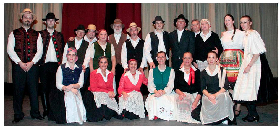
A Kolomp együttes fellépés előtt