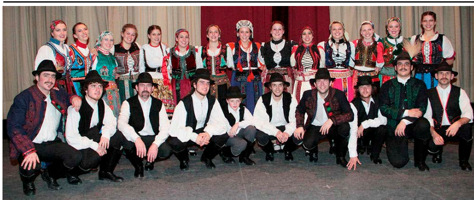
Kalotaszegi viseletes Regös csoportkép

- A két utolsó találkozóon már csak élő népzene lépett fel az együttesek (Bara zenekar 2010-ben és Dűvő zenekar most, 2012-ben), valamint az argentinai, brazil és uruguayi (ilyen sorrendben) együttesek keretében már megszülettek a helybeli zenekarjaink is.