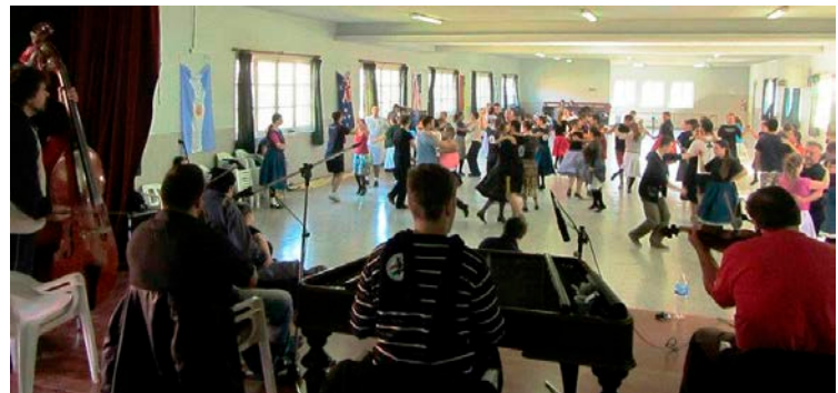
A szimpózium óriás terme

Kedves HUFIolvasó: a következő számban rövid interjúkat közlünk. Érzékeny s lélekemelő beszélgetés részleteket!