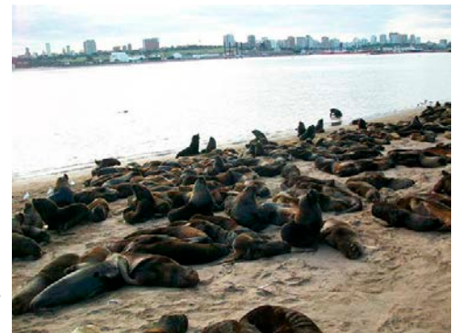
A kikötőben, a déli mólón szabadon heverő borjúfókák

Aztán sétálni vittük őket a tengerparton, megnéztük a katonai tengerész kikötőt és a polgári kikötő kis halászhajóit, a javítódokkot, a kikötőben szabadon élő fókákat. A hosszú déli móló egyik éttermében remek forró csokit ittunk.