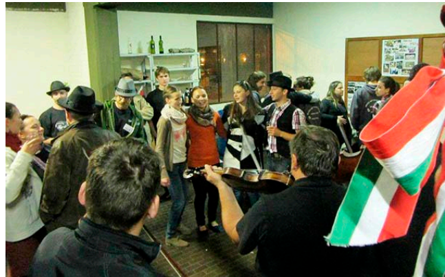
Gálák utáni táncház a cserkészházban

A néptáncos élete egy meggyőződésbe gyökerezett felfogás tükré! Ugyanis a fejlődésének nincs határa. A folklór gördül, változik, alkalmazkodik, hiszen az emberek életéről és az ahhoz fűződő szokásvilágról szól. Ezt vesszük át a városi néptáncosok oly módon, hogy ne vegyünk le, se nem adjunk hozzá fölöslegest az eredetiségéhez, hanem hűséges közvetítőkként mutathassuk meg épségét a világnak.