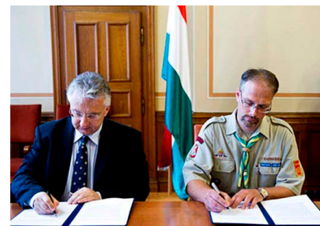
Semjén Zsolt miniszterelnök-helyettes és Buday Barnabás, a Magyar Cserkészszövetség országos elnöke az együttműködési megállapodás aláírásakor.

utáni száműzetésben a cserkészet sokat tett a külföldön élő magyarság identitásának megőrzéséért, az 1989-ben történt újjáalakulása után pedig az értékalapon álló ifjúságnevelés Kárpát-medencei újjaelésztéséért.