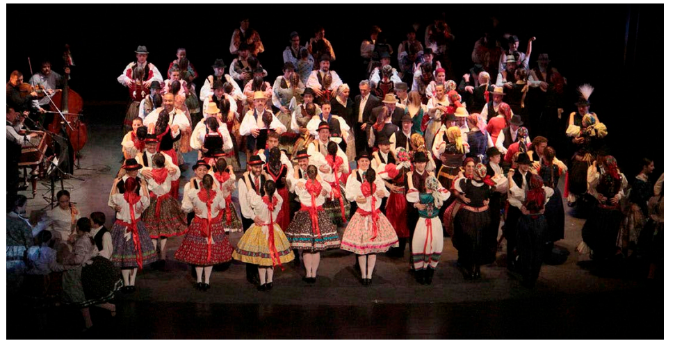
A hatalmas szatmári finálé pillanatképe

Július 28-a van... a találkozó záróünnepsége! Ez a szombat is hátborzongatóan