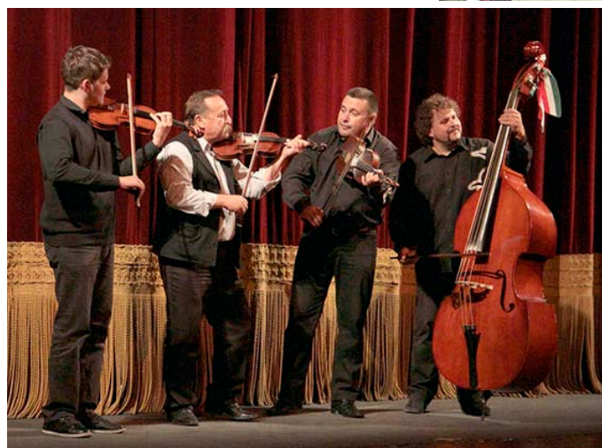
Intermezzo: Dúvó zenészek vonóskvartett szólója

A színházközönség extra ajándékot is kapott a frappáns grand finálé csattanó erejétől. A száznegyven táncos egyszerre járta, s hála a jóégeknek, hogy nem szakadt be a régi színpad alattunk!