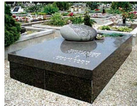
Su tumba en el cementerio municipal de Miskolc (obra de Éva Varga)

LSZ: Ahora estoy un poco desconectado, pero creo que no faltan los talentos, que lamentablemente están artificialmente retraídos o ignorados.