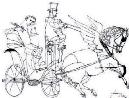
Pegasus - libre por siempre jamás

LSZ: Mirá, en mis dibujos hay dos cosas que llaman la atención. Primero, que no pueden compararse con los de ningún otro artista, por su estilo, y segundo, que nunca, nadie pudo ejercer influencia sobre mí. Cuando expreso algo en mis tintas, no hay nada, absolutamente nada que no refleje los pensamientos de mi esencia. Simplemente soy sordo y ciego ante cualquier manifestación gráfica que no es