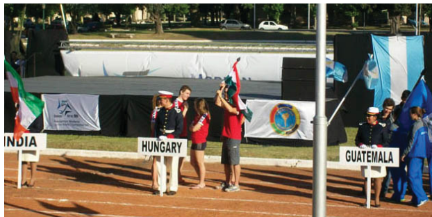
Delegációk gyülekezése: Magyarország, Guatemala és India között

aluliak, gondoltam. Kiderült, hogy ők a magyar csapat edzői, igazgatói, akik egyelőre keresték, hogy ki felelős a csapat élelmezéséért, mert ebed nem jutott nekik. Ezek után megbarátkoztunk, elbeszélgettünk és együtt mentünk fel a még elég üres tribünre. Szemben, a színpad előtt a 30 résztvevő ország egyenként 1 kiskatonát 3 ifjú bajnokkal, nemzeti lobogóval és névtáblával állított fel.