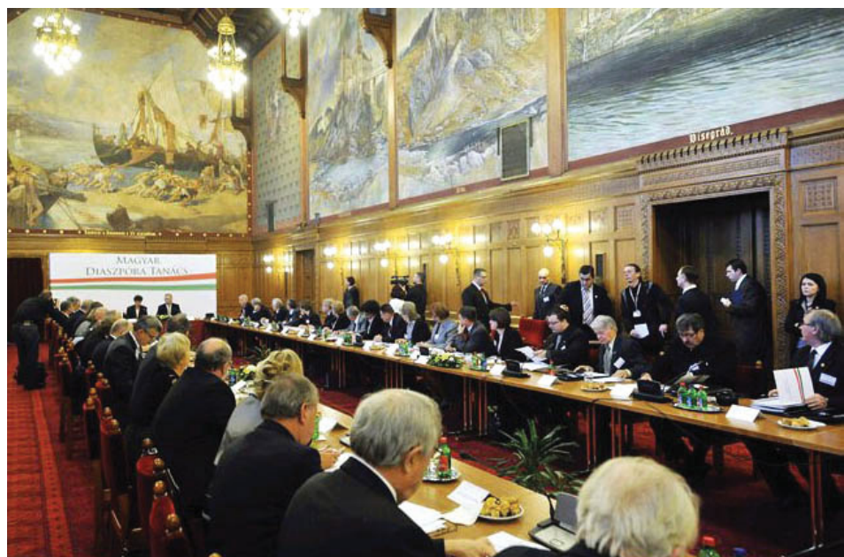
Semjén Zsolt nemzetpolitikáért felelős miniszterelnök-helyettes beszél a nyugati magyarság szervezeteit megszólító Magyar Diaszpóra Tanács alakuló ülésén az Országházban

Répás Zsuzsanna helyettes államtitkár elnökletével 2011. november 17-én, Budapesten a Parlamentben megalakult a nyugati szörványokat alkotó magyarok összefogását szolgáló Magyar Diaszpóra Tanács. Az alakuló ülésen 5 régió (köztük az egyházak és a cserkészlet) képviselőiben 49 személy vett részt. A legnépesebb tábor a NYEOMSZSZ-ban tömörült Nyugat-európai Régió alkotta 14 képviselővel. A tanácskozáson meghatározó szerepet vitt Dr. Semjén Zsolt miniszterelnök-helyettes. Beszédében kiemelte: eddig a nyugati magyarság szempontjai háttérbe szorultak, elsikkadtak, ezért is fontos, hogy külön megjelenhessenek, és az őket foglalkoztató kérdések ne legyenek alárendelve a Kárpát-medencei magyarság más típusú kihívásainak.