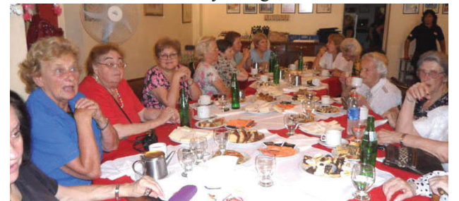
A Szent István Otthon lakói szemmel láthatóan jól érezték magukat a finomságok és néhány vendéglátó társaságában