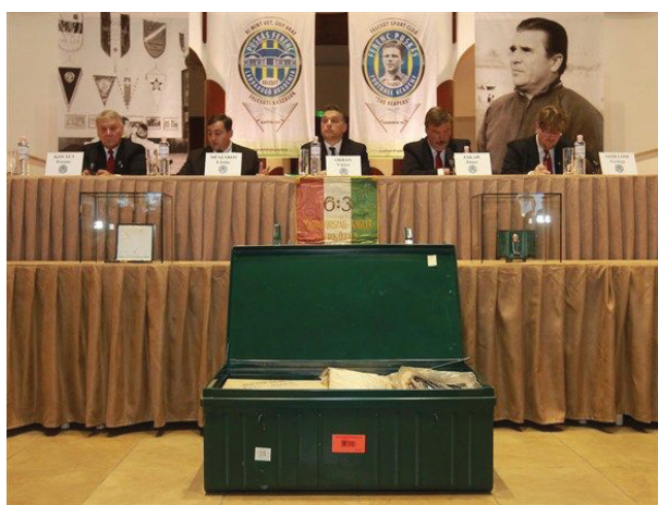
Rövidesen a nagyközönség is megtekintheti majd Puskás hagyatékát!

A hagyaték feldolgozása minden biznossal éveket vesz majd igénybe, hiszen húsz láda emlékről van szó. Az ünnepélyes sajtótájékoztató alkalmával ebből a húsz ládából mindössze egyet nyitottak fel, ám kiderült: ez az egy láda is sokkal több fotót és kézzel írt dokumentumot tartalmaz, mint amennyit eddig összesen sikerült felkutatni Puskás Ferencről. Aligha kétséges, hogy az általa összegyűjtött emlékek muzeális, történelmi és sport-értéke egyaránt hatalmas!