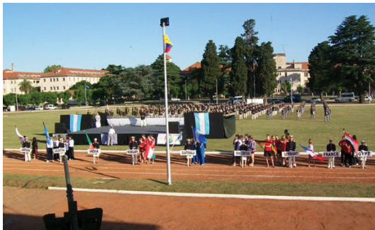
Készülődések El Palomárban, a katonaiskola óriási parkján belül