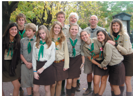
A tiszteletadás végén