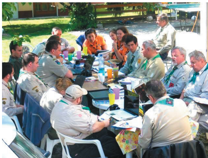
Visegrád: Tanácskozás a szabad ég alatt