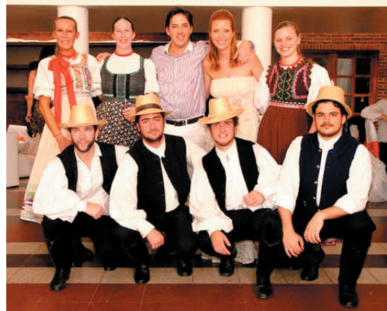
Regöseink a jegyespárral