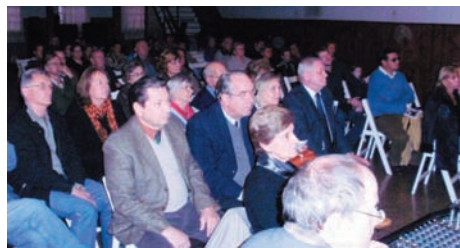
„Telt ház” vett részt a műsoron

Másrészt hadd legyek megnyugtató is: a fiatalabbak vállalkozása, megértése és meghatódása felülmúlt minden elvárt elképzelést. Az a tény, hogy egy huszonéves cserkészvezető kiönti lelkét a Hősök falánál, az, hogy egy huszonéves néptáncos könnyes szemmel veszi át a magyarság sorsa tényeinek egy részét, annyit ér, mintha ezer vártéglá tornyosodna egymás fölé egyszerre!