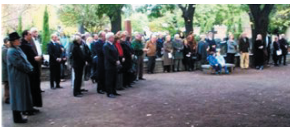
A figyelmes közönség része