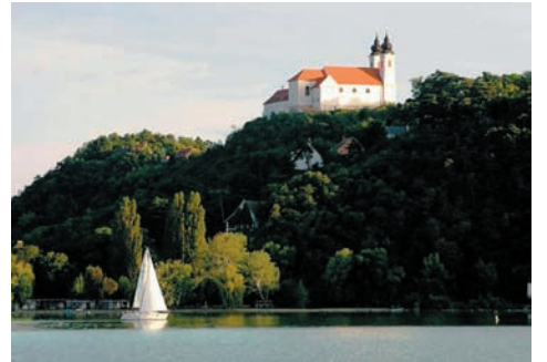
Az impozáns tihanyi apátság

Elég meglepődtem, mikor árák után néztem, és jobbkat szereztem Horvátországra, mint itt nálunk, a Balatonnál. Ahogy a fiatalok mondják itt: „ez gáz”!