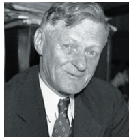
Arthur Wynne, a későbbi világsikerre szerzett "crossword" föltalálója

Égészen pontosan lehet tudni: 1913. december 21-én, a New York-i World című bulvárlapban. Feltalálója, az angol születésű Arthur Wynne már korábban kiagyalt mindenféle betűrejtvényt és egyéb rébuszt.