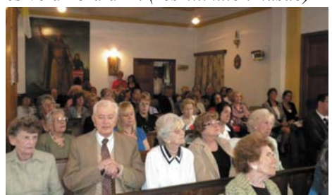
A Mindszentynum már a Református Egyháztól kapott szép, faragott fapadokkal fogadta a nagyszámú hívőt