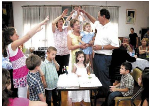
A lakodalmas torta