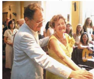
Az 50 éves házassági eskü fölüljítása

- Az áprilisi 2-i koloniális esemény, a Fóthy aranylakodalom részletei olvashatók a szomszédos rovatban. Azonban egy aranylakodalom nem lenne valódi, ha nem adnának hozzá „lakomat”. Az előre bejelentett 120 személyre 12 tízszemélyes asztalt szépen megterítették és mindegyikre kitűztek egy számot. A rendezőknek csak gratulálni tudunk, mert a korosztályok egy csoportban 1 asztalnál ülhetnek. A kicsi gyermekek és a serdülők 2 asztala