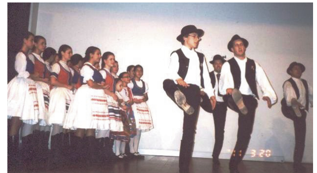
A Pántlika és Sarkantyú együtt járják a táncot