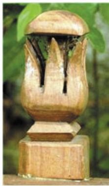
A sírfeja részletfaragásai