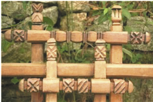
Családunk sírhalmja a kertünkben. A kopjafát Pernambuco fából faragtam (a hegedűvonók fája): két egymást átölelő, védő és támogató duplakeresztből áll, a szeretet jelképeként tulipánmintákkal díszítve