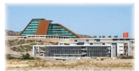
Nueva Casa de Gobierno San Luis

Buenos Aires, por el costado de la ruta N 7, pasamos frente a la nueva Casa de Gobierno, que se inauguraba el 9 de julio, y cuya construcción se realizó en 18 meses. Esta Casa de Gobierno (muy moderna, por cierto) es el 1er edificio público ecológico que contará con un sistema de iluminación inteligente, aberturas DVH (doble vidrio hermético), equipos de aire acondicionado de última generación, reciclaje de residuos, planta de tratamiento de agua y la forestación con especies nativas. El concepto de edificio ecológico se aplica a aquellos edificios cuyo impacto en el medio ambiente y entorno inmediato es mínimo, además de proporcionar una calidad ambiental interior óptima para el beneficio de sus ocupantes. Algunos datos técnicos que pudimos obtener del nuevo edificio: - El DVH reducirá en un 70% el consumo de energía de climatización y aumentará en más de un 100% el aislamiento térmico del edificio.