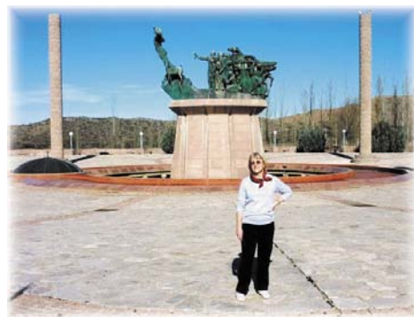
Monumento al Pueblo Puntano, con la autora

Organizados en un haz que se eleva como símbolo de los muchos y fuertes brazos que sostuvieron la Gesta Puntana, aparecen cuatro bloques de granito con imágenes de los elementos fundamentales de la gesta: la Presencia Hispánica, La Institución Capitular o Cabildo, el Aborigen o Natural de la Región y el Medio Natural. Coronando el basamento, el grupo escultórico representa el pueblo puntano en su conjunto, en actitud de ofrenda: el Cabildante, el Sacerdote, el Postillón, el Peón Arriero, la Artesana, el Miliciano Rural, el Granadero y la figura del Gobernador Don Vicente Dupuy. Culmina en una figura humana, elevándose por sobre el grupo, custodiada por el símbolo heráldico de los venados, que representa el heroísmo puntano en la lucha por la libertad.