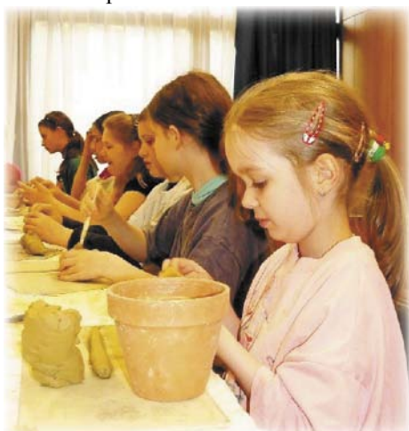
Más vale empezar joven con el oficio...

Queridos Amigos: Durante los siglos pasados de nuestra historia húngara, la alfarería fue uno de los oficios más ricos e importantes de nuestra cultura. Toda la sociedad, todos sus extractos sociales necesitaban en su hogar de los recipientes de arcilla.