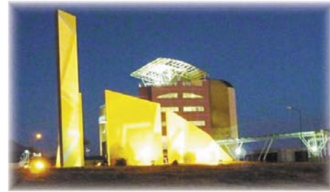
Universidad de La Punta

nueva Universidad de La Punta, que es una universidad provincial y sus recursos económicos provienen del Estado provincial. Se dictan carreras relacionadas con cine, en concordancia con la ley de promoción de la Industria del Cine, y el desarrollo de software conforme a la adhesión de la provincia a la Ley Nacional de Promoción del Software. Asimismo, se forman profesionales en las áreas de turismo, agro, empresa y medioambiente. Cabe resaltar