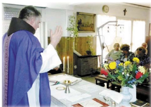
¡Que reine la armonía, la paz y el amor!

Parte de su programa entre nosotros fue una visita al Hogar San Esteban. Allí fue recibido con mucho afecto por la directiva, personal, residentes y visitantes. Durante la misa formuló peticiones especiales a Dios, que fueron acompañadas por los ruegos de los presentes.