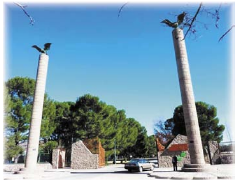
Entrada al Monumento al Pueblo Puntano (Ciudad de San Luis)