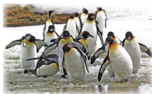
Hová, hová? Netán el?