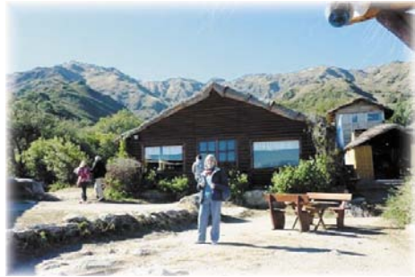
Villa de Merlo

Dicen que tiene el "3er. microclima del mundo" y, según me explicaron, está emplazada estratégicamente en el centro de la falda occidental de la sierra de los Comechingones y a 800-900 m sobre el nivel del mar. Las sierras cortan el paso de las corrientes de aire húmedo del Atlántico y de los elementos contaminantes que arrastran a su paso por la pampa húmeda. Es el macizo más antiguo de la cordillera andina y la carga eléctrica de las rocas es muy baja, con ionización negativa, la descomposición del granito libera átomos de oxígeno que en la atmósfera se transforman en ozono. La atmósfera muestra una proporción óptima de oxígeno, algo que se revela en la abundancia de líquenes que se observan en los troncos de los árboles.