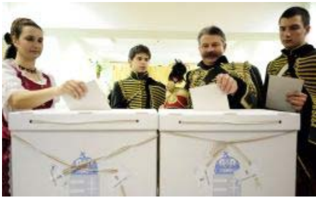
Revés para el socialismo en las parlamentarias de Hungría.

La organización de las elecciones fue un digno finale de un gobierno que no supo hacer lo apropiado durante los últimos dos períodos. La desorientación, las decisiones apresuradas y mal tomadas y, sobre todo, la falta de responsabilidad por las cosas mal hechas caracterizó el desgobierno a lo largo de estos últimos años. Así lo pensó también la mayoría de la población, y así quedó demostrado en las urnas.