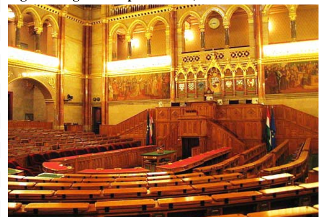
El magnífico recinto de debates del parlamento húngaro en Budapest

El descontento ciudadano llevó a los socialistas a perder más de la mitad de sus votos en esta primera vuelta de los comicios parlamentarios y lo relega a un distante segundo lugar con apenas el 19,3% de los votos.