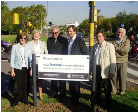
Se pueden volcar inquietudes en la página de Facebook