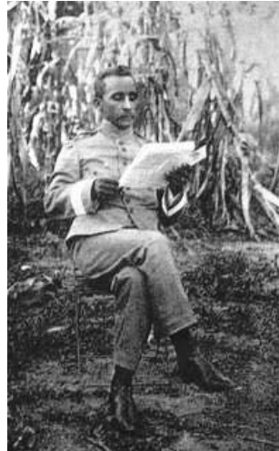
A fiatal indián-unoka kadet, Rondon

1940-től kezdve Orlando és Cláudio Villas Boas sertanisták járták a brazil