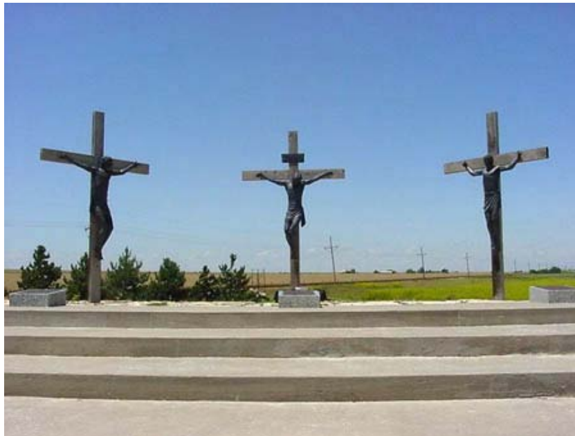
Kovácsolt fémből készült Via Crucis (részlet, Amarillo, Texas)

Egyszer a jobbszélső alatt, másszor a balszélső alatt, éppen csak hogy a középső, az igazi, üres marad.