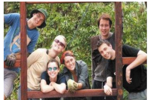
A lelkes önkéntesek egyik csoportja

A három hetes otlétem alatt nagyon sok biológiai projektet és természetvédelmi tanulmányt végeztünk a többi önkéntessel: a munka 50%-a fizikai munka volt, ami az újra erdősítési projekteket segítette, és a maradék 50%-ban a tanulmányi munkák, a különös fajok elemzésével és rendszerezésével foglalkoztunk, illetve segítettük a központ