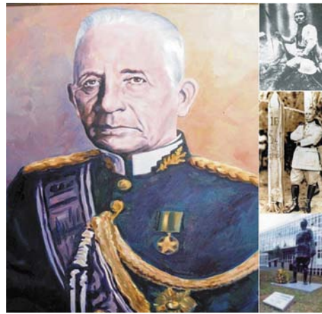
A mindenki által tisztelt Marechal Rondon

őserdőket. Amazónia határán további indián törzseket fedeztek fel és kapcsolatot vettek fel velük. Ezek a fivérek akkor csak antropológiai tanulmányokat végeztek.