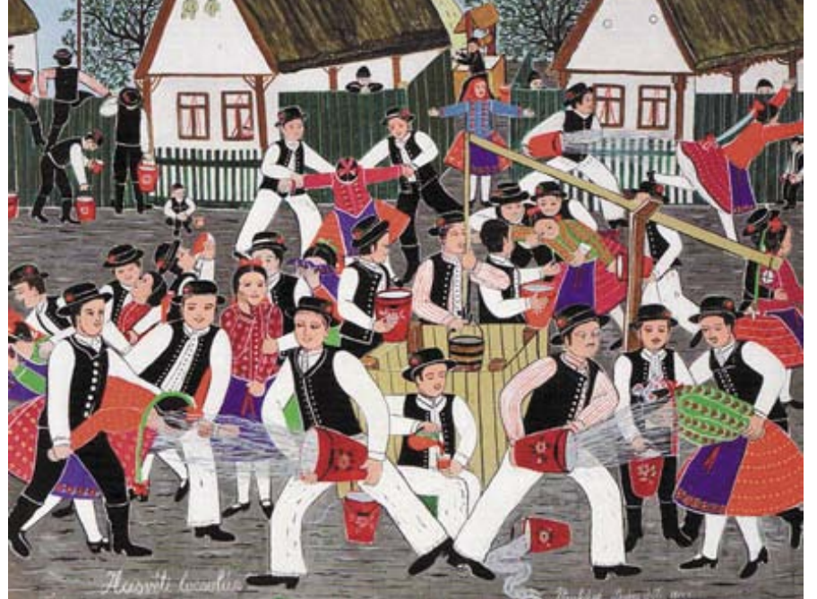
A galgamácsi Dudás Juli naiv festménye

(Csapó Endre vezércikkírónktól 2007-ben a szerkesztőnek szánt húsvéti köszöntője alapján)