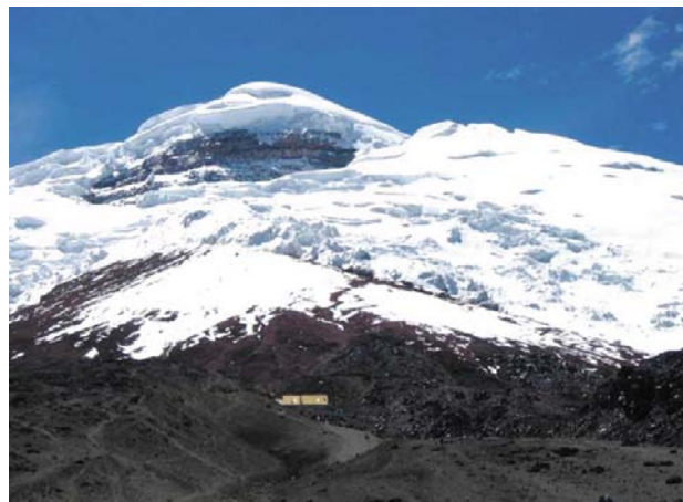
A Chimborazo vulkán