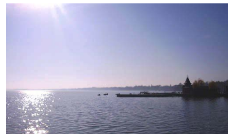
El lago Balatón, cerca de las termas de Héviz