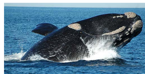
Enormes mamíferos acuáticos

puedes avistar a varias a la vez. También se ven lobos marinos como vagos tumbados en la playa (una vista muy tierna para mí).