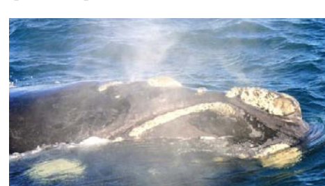
La ballena respira...

Además había tantas cosas bonitas que mirar que yo no sabía de qué estar más pendiente. También era impresionante cerrar los ojos durante unos minutos y escuchar las olas y la respiración de las ballenas, sentir la brisa marina en la cara y concentrarse en el ritmo del pequeño barco flotando... es algo único que no se puede hacer en otro sitio.