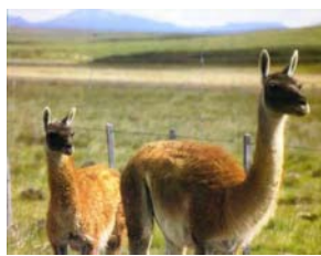
Los pacíficos guanacos