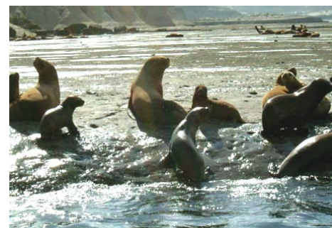
Los lobos marinos disfrutan su vida

puedes avistar a varias a la vez. También se ven lobos marinos como vagos tumbados en la playa (una vista muy tierna para mí).