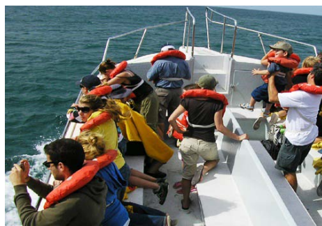
Avistaje en el barco

La señora del hostel donde nos alojábamos dijo que si alguien iba a Puerto Madryn y avistaba la ballena franca austral, o volvía cada año o se quedaba para siempre. Este avistaje se hace en una excursión en barquito