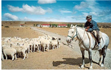
Gaucho y ovejas patagónicas

Al llegar a cualquier pueblo de la Patagonia, siempre vemos la estepa infinita, la vegetación que tanto me encanta. No hay árboles, solo hierbas y arbustos en la tierra roja y marrón, y esto permite encontrarnos con caballos, conejos, cientos de ovejas y