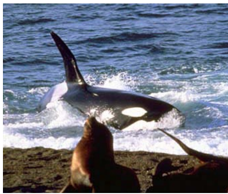
Desde la costa

También ese día visitamos el Doradillo, otra playa perfecta para tomar mate y ver las ballenas sin tener que subir a ningún barco, desde la costa, ya que es como una depresión y los animales se acercan mucho.