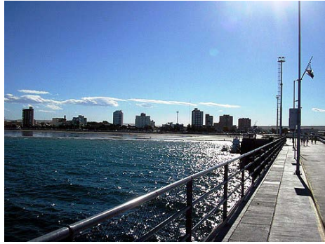
Diamantes en el agua...