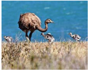
Ñandú de Punta Cantor