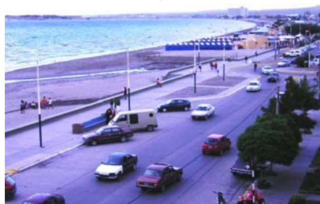
La costanera de Puerto Madryn

La historia de este gran amor empezó con un viaje de 20 horas en bus. Fueron 1200 kilómetros hasta llegar a Puerto Madryn.