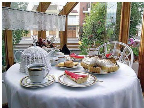
Tomar el té galés en Gaiman

Por la tarde fuimos al pueblo de Gaiman, el escenario del encuentro de la cultura argentina con la galesa. Ahí vivieron muchos galeses y todavía los hay. Se habla su idioma y también se puede participar en un certamen poético bilingüe en lengua galesa o