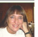
Compilado por Henriette Várszegi

y a valorar el esfuerzo que esto conlleva.