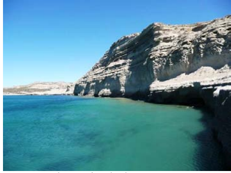
La península de ensueño

La excursión duró una hora y después de almorzar pescado, naturalmente, recorrimos toda la Península Valdés para visitar lo más lindo de mi lugar en el mundo : Punta Cantor.