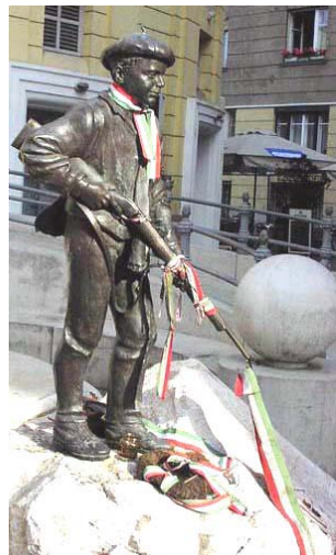
"El pibe de Pest 56", obra de Lajos Györfi (1996), en Budapest

Ardiente en la noche soñó mi sangre de veinte años No con la niña de ojos de fuego, con sus senos enhiestos, su vientre Tenso de vida futura: Soñó con Buda humillado, con Pest mancillado Por la bota del vil negrero. Y ardiente en la noche juré no vivir más mirando a las botas del bárbaro, Vivir ya con la frente y los ojos al ras de su frente y sus ojos, Cruzando pensares y miradas de acero; O más alto, tan alto como la copa del árbol más alto de mi tierra; O bien morir en la brega y que mi frente y mis ojos Tuvieran que hundirse hasta las raíces más hondas Del árbol más arraigado de mi tierra... Y aquí yacen mi frente y bisojos y mi sangre de veinte años