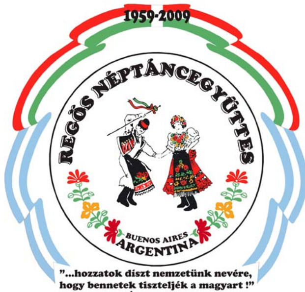
"... Colmad de decoro el nombre de nuestra nación para que en vosotros honren al húngaro" (Emil Ábrányi)

Han asistido este año más de 700 jóvenes de 29 países. Se ha logrado así estrechar los lazos con la juventud húngara de la madre patria y de la diáspora, teniendo la oportunidad de difundir el movimiento folklórico húngaro de Sudamérica tanto en Hungría como en Transilvania (actualmente Rumania) y