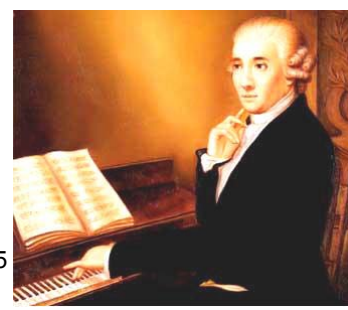
... y en 1795

N. de R.: Franz Joseph Haydn (1732-1809), gran compositor de música clásica y uno de los máximos representantes del período clásico, escribió más de 100 sinfonías y numerosos cuartetos de cuerda, sonatas y tríos para piano. Fue el responsable de grandes