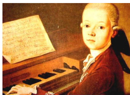
Haydn en el teclado, de niño...