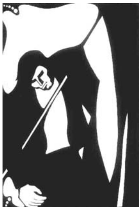
"4 de noviembre de 1956"... (representación gráfica de Zoltán Balogh)

Tarde, consume ante mi huesa tus cirios encendidos, Aurora, derrama sobre mi huesa tus lágrimas virginales.