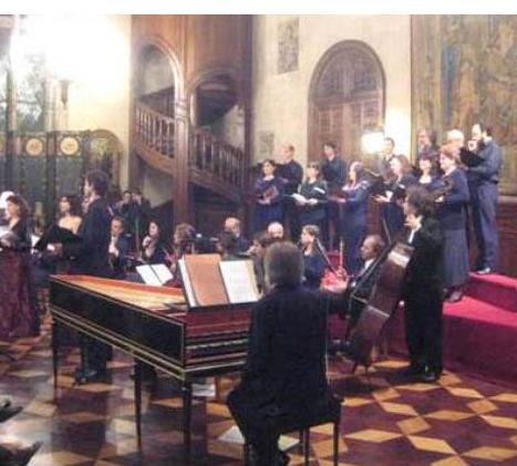
La bella cantata de Haydn en 1ª audición local se lució especialmente en el hermoso salón del Museo de Arte Decorativo de la Ciudad

El concierto del Museo Nacional de Arte Decorativo constó enteramente de obras de F.J. Haydn en conmemoración de los 200 años de su fallecimiento, y fue dedicado a la memoria de la vicepresidenta y generosa patrocinadora de Ars Hungarica, Senta Hohenlohe Waldenburg de