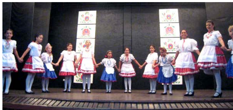
↑ A Gyöngyösbokréta táncsoport a kicsikkel együtt