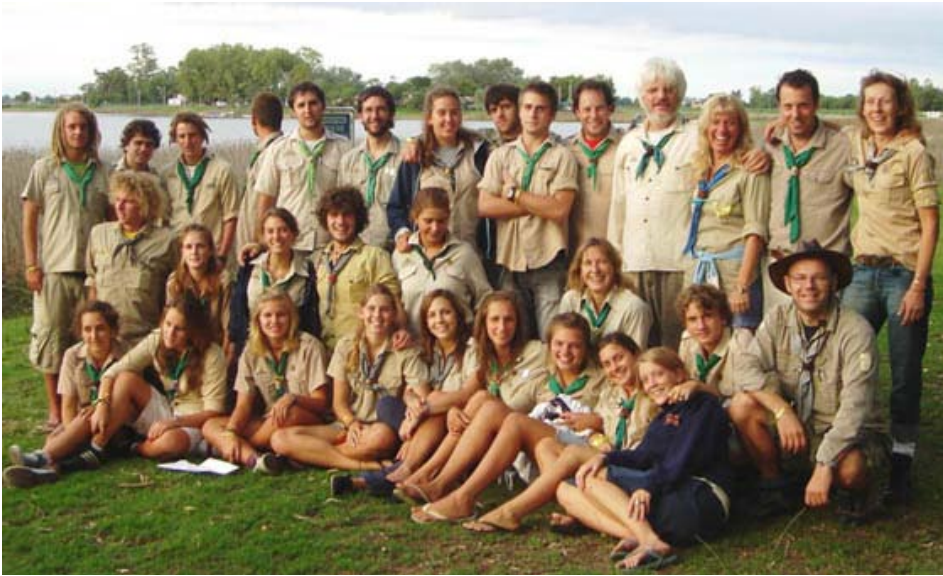
A VEKI-n résztvevő vezetők

Egy elképzelés rövid időn belül hagyományra változhat, ha értelmes, tartalmas és a jövőbe nyújtja át emberformáló kezeit... Ha olyan igényt ébreszt fel, hogy a gyakorlatban szükségét jelent több mindenki számára.