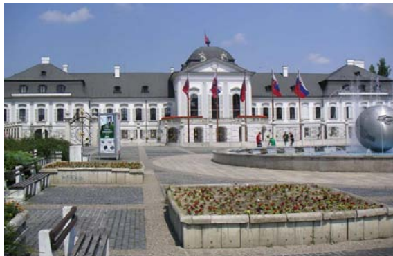
El palacio Grassalkovich sirve hoy de residencia presidencial