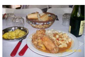
¿Quién no comería con gusto?...

Aprovechamos la ocasión para realizar una de nuestras comidas típicas: Paprikás Csirke. Yo era el cocinero,