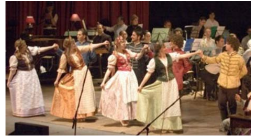
El conjunto Regös se lució muy especialmente (aquí, el tradicional Palotás)