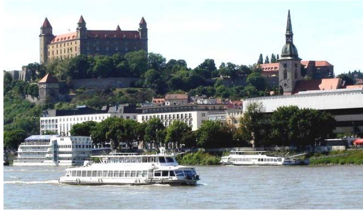
Bratislava (hasta 1920: Pozsony en húngaro, Prešporok en eslovaco, Pressburg/Preßburg en alemán) es la capital y mayor ciudad de Eslovaquia (446.819 habitantes/2005), situada a orillas del Danubio, cerca de las fronteras con Hungría y Austria. El castillo, actualmente museo, data del siglo XV

También le sugerimos al ministro de educación que hojee un poco los libros de historia, de los cuales comprenderá un poco más claramente la razón por la cual se escucha tan frecuentemente nuestro idioma en su capital . Resulta que la hoy llamada Bratislava antes era Pozsony y perteneció al Reino de Hungría hasta después de la Iª Guerra Mundial. Desde 1450 fue titulada "Ciudad libre del Reino húngaro".