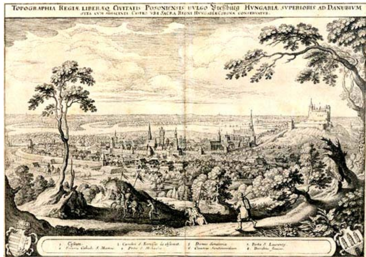
Lámina con vista de Pozsony en el siglo XVII

Un factor importante de tener en cuenta es que la población húngara local no ha inmigrado a Eslovaquia , sino que es oriunda de allí desde "siempre", es decir, desde la conquista de la Cuenca de los Cárpatos por los húngaros en el año 896... Pozsony se situaba en una de las primeras provincias ( comitatus ) creadas por los húngaros alrededor del año 1000.