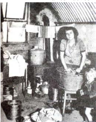
Esposa de ministro dedicándose a las ineludibles tareas diarias en su nueva "vivienda"

Demolieron con esto un sentimiento de orgullo nacional, un estilo, una elegancia y una forma de vida. Esta parte de la sociedad era (salvo raras excepciones) gente con una