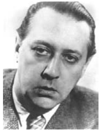
El joven Márai, en los años de sus primeros éxitos en Hungría

Quien lo leyó, sabe que las páginas de sus libros seducen desde el primer instante. Basta sólo con adentrarse en el mágico universo de su obra, donde abundan intensas reflexiones sobre la vida, para caer en las redes de este escritor húngaro.