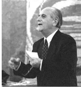
El poeta Tibor Tollas, recitando sus versos en la emigración

Este poema surgió de la inspiración del poeta en el fondo de las cárceles de Vác, en 1955, y fue memorizado estrofa por estrofa por los demás presidiarios, ya que carecían de papel y lápiz para poder volcarlo al papel. Cuando los revolucionarios patriotas de 1956 liberaron a los presos "enterrados vivos", el poema finalmente pudo escribirse y divulgarse. Fue publicado después del exilio del autor, en la emigración, en Munich. Sus restos descansan en su ciudad natal, en la patria, cuya liberación del yugo soviético le tocó aún en vida. (SKH)