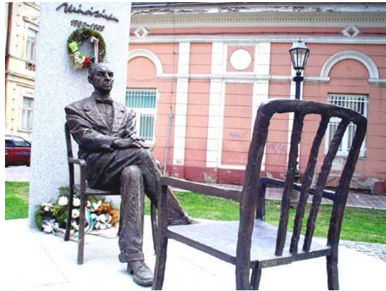
El homenaje póstumo: Monumento en su ciudad natal, Kassa

En las ediciones de La Salamandra, las obras de Márai llegaron a la Argentina en