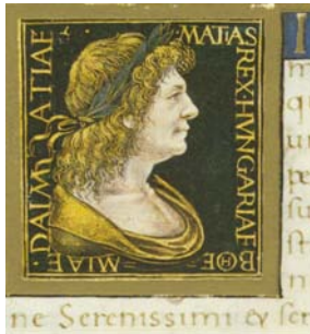
Imagen de Mathias Corvinus, en uno de sus famosos códices Corvina

y goce de todos los placeres del sentido era parte de la cultura de todos los monarcas. Nuestro rey fue un „Rey del Renacimiento”, pero sin el derroche y el lujo desplegado por ejemplo unos años más tarde en Francia por Francisco I°, o el fasto y la codicia de los Borgia. Su meta fue afianzar su reino, al tiempo de reforzar en su pueblo la fe en Dios y el arraigo en las tradiciones. Fue un gran mecenas, protector de las artes y las ciencias, para cuya difusión hizo venir a su corte los más eximios representantes de esos quehaceres. Fundó la famosísima Gran Bibliotheca Corviniana , de la que se dice era una de las joyas de la corona húngara y que se convirtió en una de las bibliotecas de mayor renombre del mundo del Renacimiento. Matias empezó a juntar los libros alrededor de 1490 y, a su muerte, se dice que contaba con alrededor de 3000 códices, o „Corvinae”, que incluían unas 4 a 5 mil obras mayormente de autores clásicos latinos y griegos. Hoy sobrevive un total de unos 650 de estos incunables, dispersos en varias bibliotecas en Hungría y Europa. Alentado por el ejemplo del rey húngaro, Lorenzo de Medici fundó en Florencia su propia biblioteca griega y latina. La Biblioteca Nacional Széchényi, de Hungría, está actualmente empeñada en restaurar en forma digital sus propios ejemplares del legado de Mátyás.