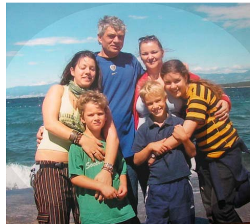
en Hungría... (con esposa e hijos, playas del mar Adriático, verano de 2006)