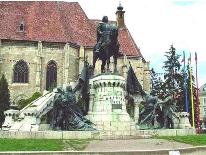
Estatua ecuestre del rey Mátyás Hunyadi e Iglesia de San Miguel, en Kolozsvár (hoy Cluj-Napoca, Rumania)

Amanecía un día muy frío un día de enero de 1458, y para la tarde las grandes tablas de hielo en el Danubio se terminaron de congelar en una gran capa compacta. Para los nobles de esa época pareció un signo del cielo, y decidieron que había que liberar a Matias, preso en Praga. A su regreso con Matias liberado, y antes de entrar en Buda, lo proclamaron rey sobre el río congelado. Los integrantes de la asamblea no se equivocaron: Matias mereció la confianza puesta en él. Llegó a ser un rey excepcional.