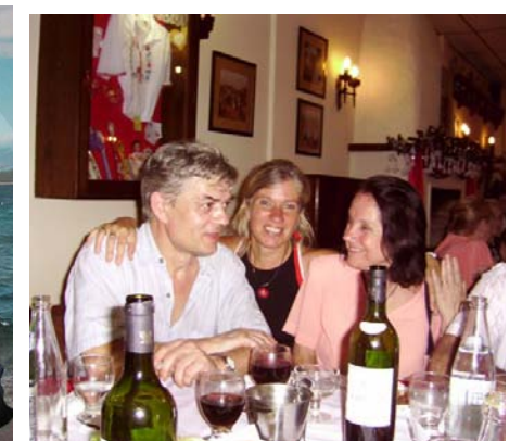
... y en la Argentina (Año Nuevo 2007, en el Club Hungría, siempre feliz reencuentro con su madre y hermana)