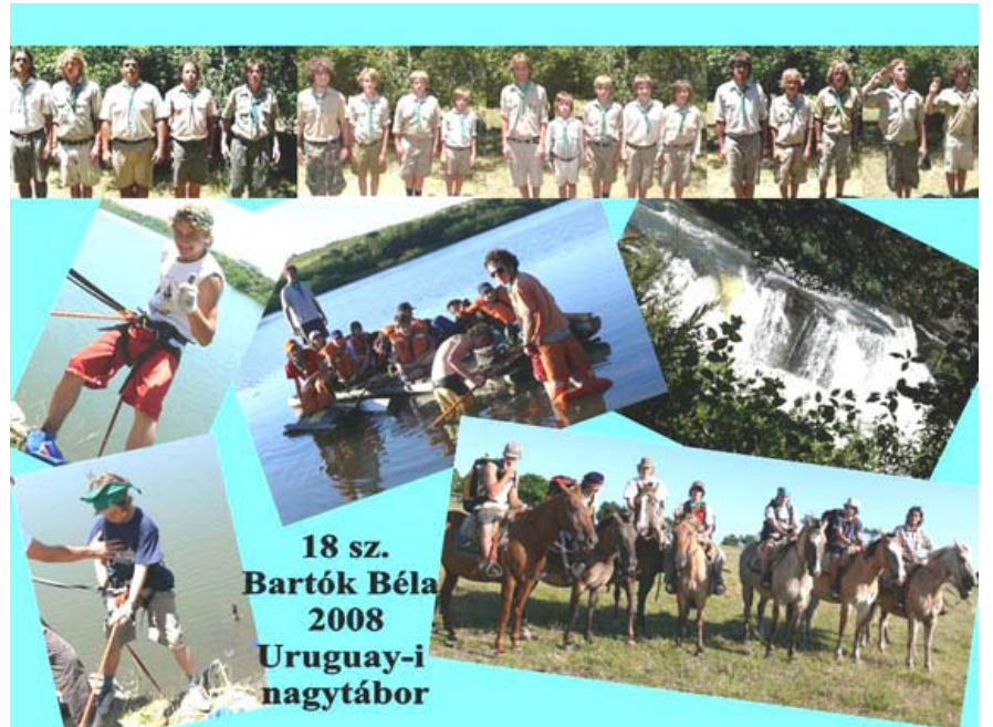
18 sz. Bartók Béla 2008 Uruguayi nagytábor