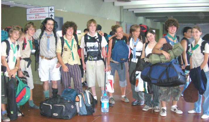
Vidám indulás a braziliai VK-ra! A „Bogáncs” leányok a csapattáborból egyenesen Posadasban szálltak fel a buszra

Ilyen szerepben álltam a cserkész táborokra indulók csoportjai mellett. Szótlanul. A nyüzsgés dagadó hulláma ez egyszer sem sodort magával. Csupán figyeltem a kedves arcokat: csillogtak! Az ismert kezeket: cipelték, tologattak, halmoztak. Hallgattam a kedves hangokat: táncoltak! Hadd ismételjek még egy szót: „sziget” voltak a végállomás iszonyatos forgalma közepén. Drága zöldnyakkendős figurák az utazás előtti láрма sakktablóján. A ca. 40°C nem számított. A szakadó nyári zivatar sem. A batyupakolással járó tolongás sem. Minden egyes résztvevőn látszott a valódi, önfeledt boldogság! Jól értjük ezt már: a cserkészélet sosem kifogyó boldogság-fűszer! (Az összes táborról közlünk beszámolót következő számbunkban).