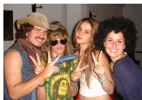
A jóképű cowboy sikert arat...