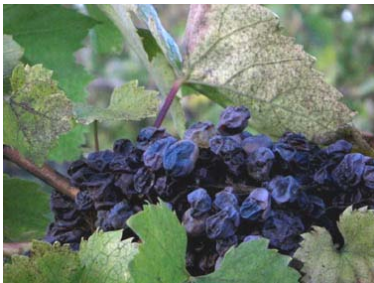
Aszúsodott fürt az Istenhegyen (közelről)

A hosszú, száraz őszyk, reggel ködös és harmatos, de verőfényes nappalokon a botrytis szürke penésze lassan befedi a már érett, magas cukorfokú szőlőszemeket, amelyek a sejtnevé (víz) egy része elpárolgásával összetöppednek a tőkén. A gomba behatolása a bogyóba egy aromákban gazdag, finom ízvilágot hoz létre, ami jellegzetessé teszi a tokaji borkülönlegességeket, és megkülönbözteti az édes, késői szüretelésű vagy jégbor fajtáktól, ahol nincs botrytis támadás.