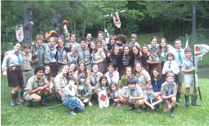
Az egész tábor

sátrakat, eláztatta a szép füves réteket - de egyet nem tudott elmosni: a jókedvünket és találekonyágunkat! És csodák csodája, az őv. portya éjszakáján teljes fényességében kisütött a telihold!