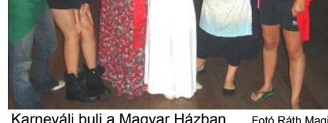
Karneváli buli a Magyar Házban