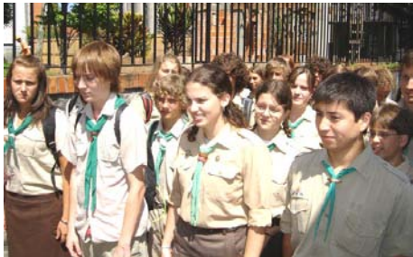
Órsi felállás az induláshoz

Másnap reggel már teljesen tiszta egyenruhában ott álltunk a Szent Imre Kollégium előtt, és az örömteli találkozások, ölelések után buszra szálltunk és kiindultunk a táborhelyre, Juquitibába.