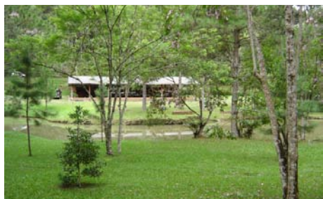
Ebédlő a távlatból, az őserdőtől „elnyert” térségen

A konyha kifogástalanul működött: ízletes és változatos volt az étrendünk. El is hangzott az asztaloknál, hogy „még otthon sem eszünk minden nap ilyen finomakat”.