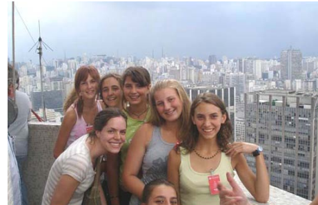
A Banepa toronyban

A tábor után volt még pár „civil” nap, amikor különböző csoportosulásban városi programok voltak soron: MASP Szépművészeti Múzeum, Butantan kígyóintézet, a Banepa torony 35. emeletéről São