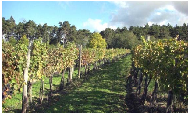
Rátka szélén, az erdő alatt

A hosszú, száraz őszyk, reggel ködös és harmatos, de verőfényes nappalokon a botrytis szürke penésze lassan befedi a már érett, magas cukorfokú szőlőszemeket, amelyek a sejtnevé (víz) egy része elpárolgásával összetöppednek a tőkén. A gomba behatolása a bogyóba egy aromákban gazdag, finom ízvilágot hoz létre, ami jellegzetessé teszi a tokaji borkülönlegességeket, és megkülönbözteti az édes, késői szüretelésű vagy jégbor fajtáktól, ahol nincs botrytis támadás.