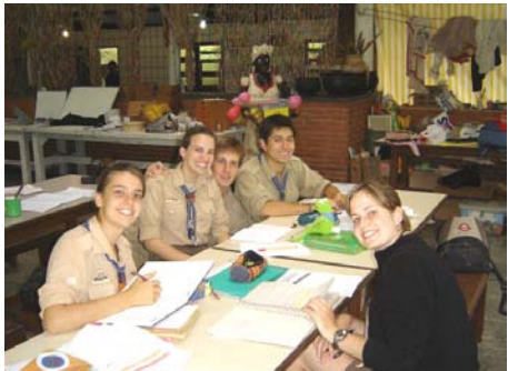
Tanulás és „fényképezkedés”

A lerakodás, elhelyezkedés, sátorverés ment, mint a karikacsapás. Már az első előadások is megindultak, és akkor szép lassan, alattomosan elkezdett esni az eső... és többé már el sem hagyt bennünket: 10 napunkból mindössze 2 nap nem esett. Esett reggel, esett déln, esett este, esett a táborfüzerekre, a sorakozókra, átáztatta a