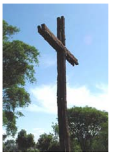
(Fotó Nt. Tóth L. Kristóf, San Pedro, Argentina)

Jöjj Föltámadott szívünket újra töltsé be lényed, értelmetlen Nélküled az élet. (Herjeczki Géza, 1980)