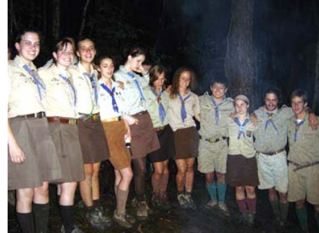
A zárótáborúzt körül

Az őv. és st. avatásra szerencsénkre nem esett az eső. Így ennek a megható szépségét és varázsát nem zavarta meg semmi.