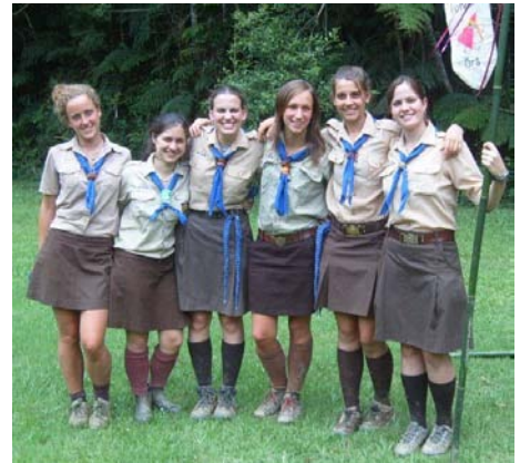
Leány segédtszjelöltek