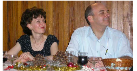
A Bács házaspár figyel az egyik főlköszöntőre az AMISZ által szervezett búcsúvacsorán, a Mindszentynumban

Közben értesített, hogy szerencsésen megérkeztek, és - ahogy írja - azóta kissé tudathasadós állapotban egyszerre kell az új munkakörével járó feladatokat tanulnia, miközben „még benne él Argentína...” - Közljük hivatalos búcsúlevelét a kolónia felé, amelyet indulása előtt pár nappal juttatott el hozzánk: