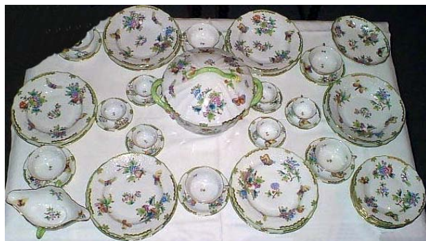
Parte de la magnífica vajilla, encargada por la reina Victoria

La reina Victoria encarga un juego completo Herend para el palacio de Buckingham, con una decoración que nació inspirada en el arte chino. El motivo fue llamado "Reina Victoria", y es desde entonces tal vez el más conocido en el mundo entero por sus mariposas y estilizadas flores.