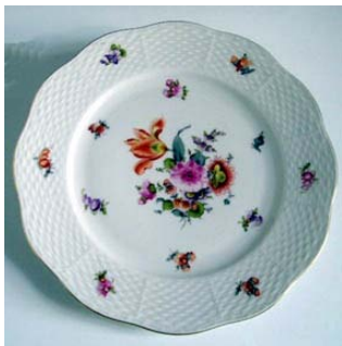
Plato de postre

estilo particular pero a la vez aceptado internacionalmente. Luego de las primeras exposiciones nacionales e internacionales, la fábrica se hace cada vez más conocida y empieza la primera ola de encargos. De ahí en más, el emperador Francisco José I , rey de Hungría, en reconocimiento a su trabajo, le permite utilizar en la marca el escudo