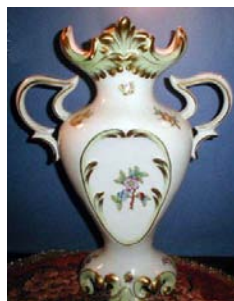
Floreros con motivos "Queen Victoria"

La reina Victoria encarga un juego completo Herend para el palacio de Buckingham, con una decoración que nació inspirada en el arte chino. El motivo fue llamado "Reina Victoria", y es desde entonces tal vez el más conocido en el mundo entero por sus mariposas y estilizadas flores.