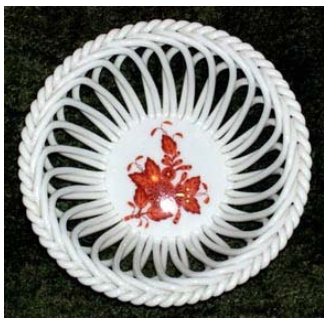
Canastita en filigrana

Luego de ese incendio aparecen las decoraciones y formas más imaginativas. Se incorporan elementos de flora y fauna autóctona, dando por resultado un estilo más propio húngaro. Fischer sabe que debería perfeccionar aún más su producto y piensa que la mejor manera de hacerlo es imitando la competencia: a las grandes fábricas como Meissen o Sèvres . Trabaja con sus ideas, las estiliza, les incluye elementos decorativos propios, consiguiendo un