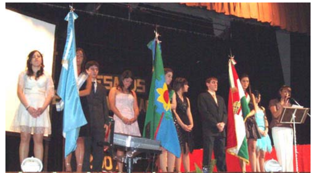
Egresados año 2007