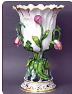
Artesanía de alto vuelo en los acabados y la decoración de estas piezas únicas

(Seguiremos con la historia apasionante de esta fábrica en nuestra próxima entrega. La R.)