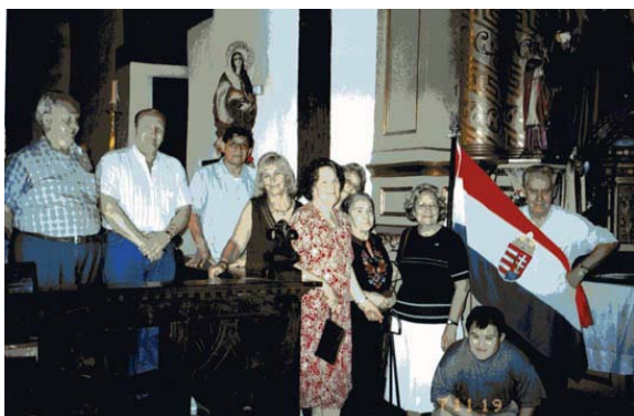
Agrupación Húngaros de Santa Fe (Capital), con su bandera húngara