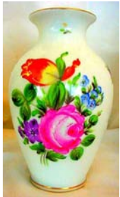
Florero al gusto vienés