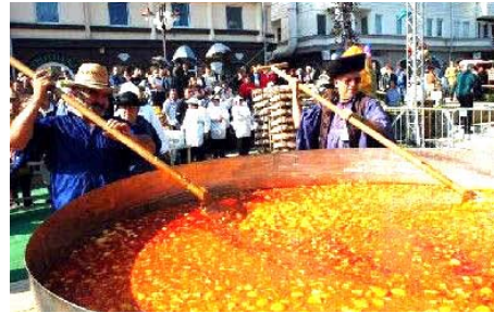
Fotó József Kasza

(Gentileza de Omar Zoli Giménez y La Crónica 15.10.07)