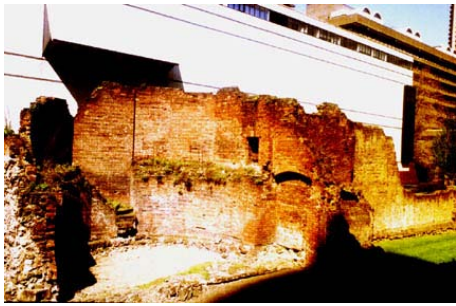
A Római Birodalom nyomai...

De még mennyi! Sőt, már Huszka idejében is volt, mint azt a „Bob herceg” operett indulója bizonyítja... Így hát egy rövid cikk keretében nem is lehet mást tenni, mint pár esetvonással képet adni ennek a több mint 2000 éves városnak kevésbé ismert arculatáról.