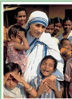
(Kalkuttai Boldog Teréz anyja)

„Ebben az életben nem tehetünk nagy dolgokat, csak kis dolgokat tehetünk nagy szeretettel.”