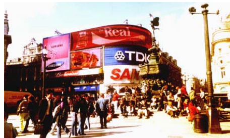
A híres Piccadilly Circus

Nelson admirális óriási oszlopra helyezett szobra körül tiszteletteljes csend uralkodik, de onnan alig 200 méterre a híres Piccadilly Circus -on a legfelszabadultabb fiatalok tömege lepi el a teret; cigaretta, drog, ital - de a földön egyetlen papír sincs: használják a nagy szemétkosarakat!