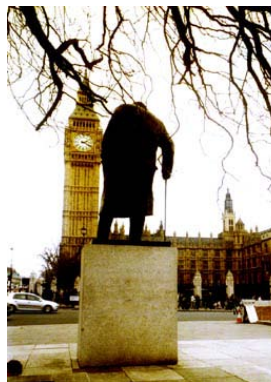
Churchill és a Big Ben

A híres Big Bennel szemben áll Churchill szobra. Nem hízelegtek annak, aki nem győzelmet, csak „vért, izzadságot és könnyeket” ígért a harcoló nemzetnek. Itt úgy ábrázolták, ahogy élete végén volt: hajlottan, botra támaszkodva.