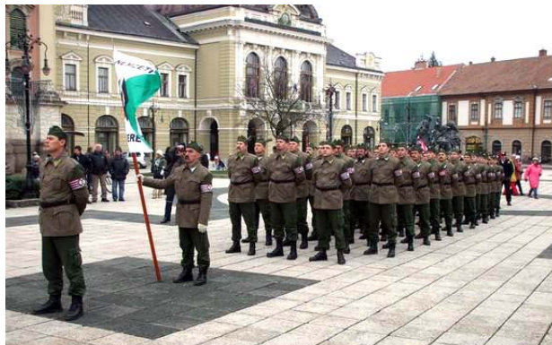
Nemzeti Őrsereg alakzata a Dobó téren (Eger)

Egerben november 17-én megalakult a Nemzeti Őrsereg, az egri Jobb Egerért Mozgalom. Közel 60 tagja az egri vár alatt, a Dózsa György téren gyülekezett, ahol csatlakozott hozzájuk 10 egri Magyar Gárda tag is.