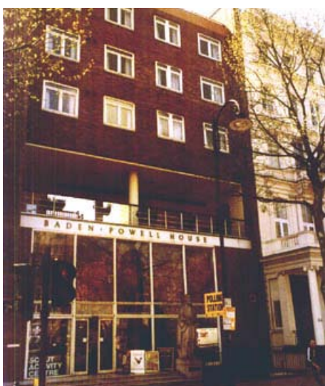
Lord Baden Powellról elnevezett Nemzetközi Cserkészközpont

Ahogy az ember kilép ebből az irtózatosszerű épülettömegeből, mindjárt mellette van a Nemzetközi Cserkészközpont négyemeletes nagy háza, ahová egy életben egyszer minden cserkésznek el kellene záródokolni, mint a mohamedánoknak Mekkába. Noha rengeteg a cserkészemlék, kép, bizsu, azt hiszem inkább a leánycserkészeknek van dedikálva, mert a vendéglátó részleg előcsarnokában