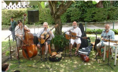
A KALÁKA a Szeretetház kertjében

- A KALÁKA Együttes vendégszereplése. A Segélyegylet vacsora keretében mutatta be a nagynevű zenészcsoporthoz a magyar kolóniának és a brazil közönségnek. Az est gazdagítására a Pántlika és Zrínyi táncsoport is szerepelt. Minden elővetelben eladott jegy elkelt, és komoly anyagi siker volt az eredmény.