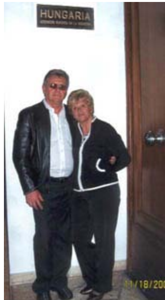
A Tanyi házaspár Calgaryból, a Hungária Egyesület bejárata előtt

Nem is tudom szavakban elmondani, hogy milyen meghatározó volt a Buenos Aires-i látogatásunk, 50 (!) év után. Azt a sok szeretetet kapni, amiben részünk volt, meg olyan sok régi baráttal találkozni Olivison... Nagyon élveztük a Karácsonyi Kántálást meg a ZIK évszázó ünnepét. Ez volt a legemlékezetesebb nosztalgizáló esténk veletek együtt!