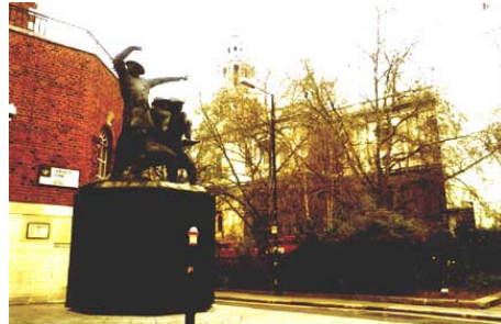
A tűzoltók emlékműve

A háború alatt nagymennyiségű német V-repülőbomba zuhant a városra, és 200 tűzoltó - egyharmada nő - áldozta életét a város megmentéséért.