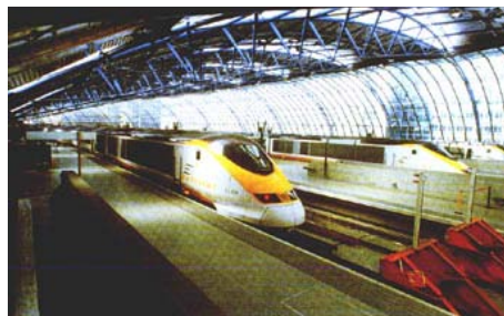
Indul az Eurostar vonat Párizsba (vagy Brüsszelbe), a Csatorna-alagúton át

A csodálatos Eurostar tenger alatti alagútján 2½ óra alatt suhan át a vonat Párizsba. A föld alá helyezett Waterloo-i pályaudvaron óriási a forgalom, hiszen naponta 10 szerelvény megy Párizsba odavissza, másik 6 Brüsszelbe. A viszonylag szűk helyen mégiscsak soha fennakadás. A 3 hónappal előbb Buenosban vásárolt jegy adatai szerint halálpontosan indult a vonat, senki sem ült a helyemre... Szinte nem is érezni, hogy egyáltalán mozog a kocsis, és amikor megy le a tenger alá.