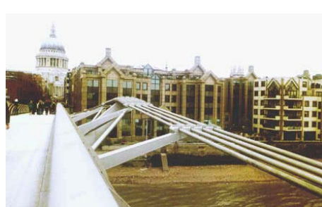
A Temze, egy „tipikusan londoni” borús napon...

A folyó igen alacsony vízállása miatt jól lehetett látni a homokos medret. Egyetlen