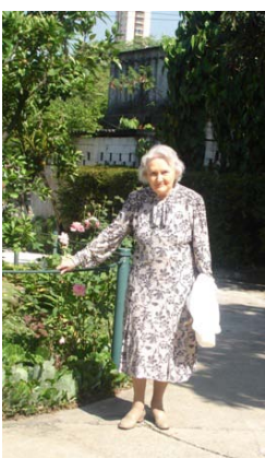
Egy bentlakó a kertben

Közös karácsonyfadíszítés, ajándékok kiosztása lakóknak és alkalmazottaknak. Magyar és brazil karácsonyi énekek közös éneklése. Minden lakónak van egy önként jelentkezett „keresztmamája” a kolóniából, aki ilyenkor ajándékkal lep meg „keresztgyerekeit” (2006. december 16).