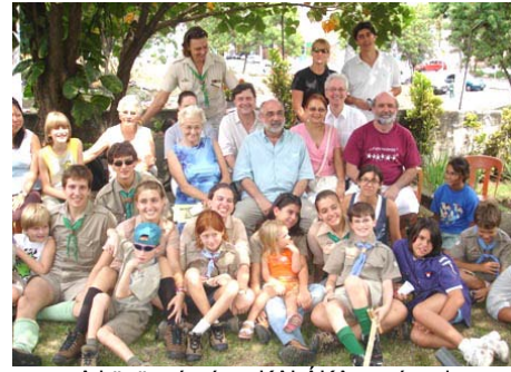
A közönség és a KALÁKA zenészei

- A KALÁKA Együttes még gyermekprogram előadást is szervezett a Szeretetházban (2007. március 11).