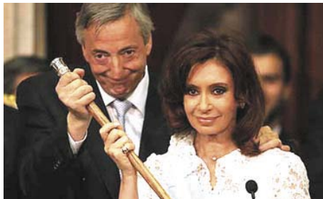
A volt elnök feleségével, az új elnökönnel - ezentúl hivatalosan is együtt vezetik majd az országot, mint ahogy közösen tartják a hatalmi „jogart”?

Temetésre emlékeztet. Semmi ünnepélyesség. A mindig megható Granaderos lovas-dízkíséret, minden hatást veszve, valahol oldalt, óvatosan lépdel. Sajnálom a lovakat... A lóhátas, bátor trombitások meg csak fújják-fújják az indulót. Túlharsogják őket a kócos, gyalogos dobosok. Új rezsi, újszerű rendezvény. Szerencsére kisütött a nap. Fel a fejjel! Reménykedjünk! A tisztes távolba zárt tömeg tombol, furcsa zászlókat lengetve. Az Elnöki Palotában (a Rózsaszín Házban) elhangzott köszöntőket biztosan olvastatok. Mi is csatlakozunk a jókívánságokhoz és a sok „Júdás-csókhoz”.