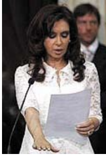
Cristina Fernández de Kirchner esküvétele

Imádkozunk, több hittel, jó kedvvel, életkedvvel . Olyan életkedvvel, ami megteremt az erőt, bátorságot, bőséget, fennmaradást - és a szaporodást.