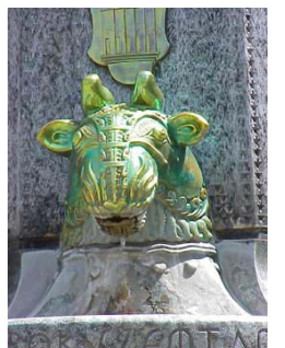
Detalle de la fuente

picarescas, humorísticas y muchas veces caricaturescas.