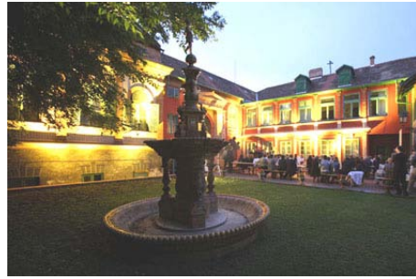
La fábrica Zsolnay, Pécs

nueva en el esmaltado, mezclándolo con óxido. Así obtiene un bajorrelieve en el decorado. En la Exposición Internacional de París arrasa con los premios, las medallas de oro y los títulos de honor.