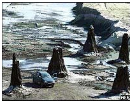
Nótese el tamaño del auto

- Un antiguo bosque de cipreses fosilizados de la especie conocida como Gran Ciprés del Pantano que vive entre 200 y 300 años y que se estima data de hace ocho millones de años , ha sido descubierto en Hungría. 16 tocones de 2 y 3 metros de diámetro y unos 6 metros de alto, preservados tal cual lucían en