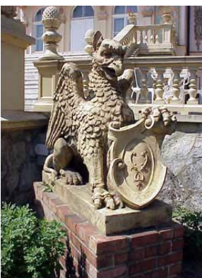
Grifón guarda la entrada de la residencia Zsolnay, en Pécs

Muchos edificios famosos en Hungría y en Europa muestran estos brillantes mosaicos o tejados (entre otros el templo del Rey Matías y los baños termales Lukács, en Buda, el Museo de Artes Aplicadas, en Pest, el Teatro Nacional de Pécs, en Viena la Policlínica, obras en Praga, en Sarajevo, en Fiume, etc.) Su incansable espíritu y la necesidad de mantener suyo el mercado ganado lo empuja a buscar constantemente algo nuevo - ¡algo desconocido e imitable! Lo logra en 1893, con un nuevo esmaltado de brillo metálico e irizante. Este juego de