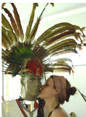
Museo de Santa Cruz, con mi novio...

Mi hostel está lleno de jóvenes estudiantes de odontología, ya que se está realizando en Sucre un Congreso de Odontología. Ayer conocí un par de chicas y chicos, muy agradables y amigables, y me pidieron