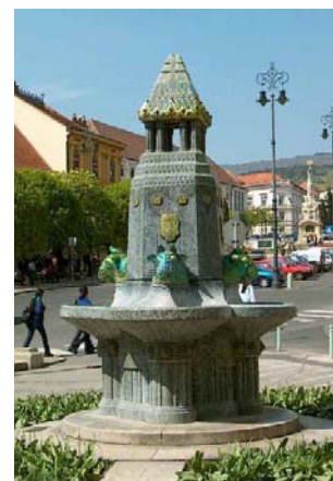
Fuente en la Plaza de Pécs