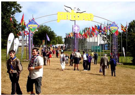
Isten hozta a Dzsomboríra!

Július 27-e du. az angliai Hylands Parkban (Essex) megkezdődött az alapításának 100 éves évfordulóját ünneplő cserkészmozgalom Jubileumi Dzsomborija . Ezen a nagyszabású seregszemlén a világ több mint kétszáz országában működő 28 milliós taglétszámú nemzetközi ifjúsági szervezet negyvenezer képviselője, köztük hat-