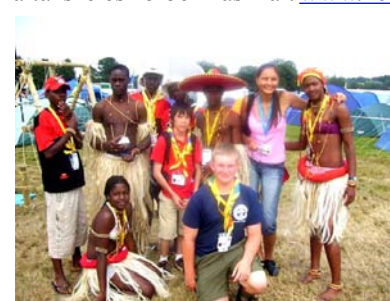
A világ minden tájáról...

Még egy ajándékkal szeretnénk cserkészeinket meglepni. 2007. július 27-től a Bethlen Gábor Alapítvány gondozásában működik tovább a külhoni magyar cserkészek által széles körben használt www.nemzetismeret.hu honlap.