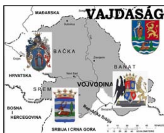
A Vajdaság címe Bácska, Bánát és Szerémség címeréből áll

„Az autónk nem kellett sorba álljon. Nem volt ott senki más, mint mi öten. Csend volt. Alig két lámpa fénye, már majdnem teljesen sötét sarkokkal megfűszerezve. Enyhe lárma, útlevelek utáni siető kapkodás. Fagyos hideg. Hozzánk közeledett valaki. Már a járása sem tetszett. Forgolódtam az ülésemen.