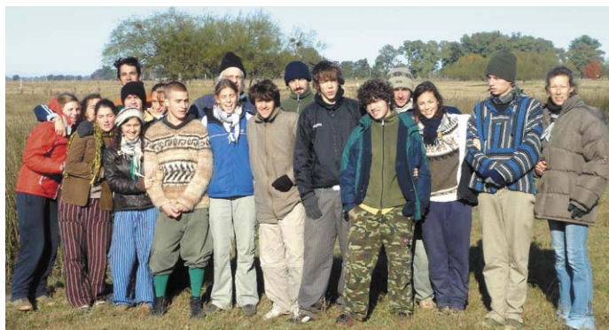
A kiránduló vezetők

„...érdeemes cserkészvezetőnek lenni...”