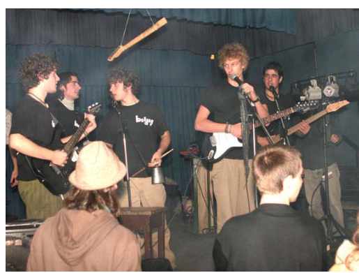
A BOLDOG együttes

A ZIK ösztöndíj-program jegyében a szülők ismét megrendezték a „Túnel del tiempo” bulit. De nem azt akarjuk megemlíteni, hogy változatlan sikerrel zajlott le, hanem kiemelni a HUFI közösségnek rock-bandája újabb kiváló megjelenését a Hungária színpadán. A BOLDOG