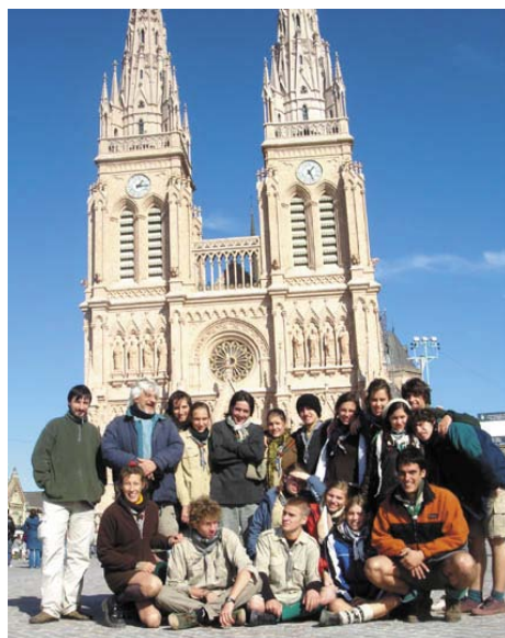
A lujáni bazilikánál

Így hát végig simogattuk lelkünket ezen a hétvégén, ugyanis hazafelé jövet „bekukucskáltunk” egy pár percre a lujáni bazilikába is, ahol egy rövid fohász után lementünk együtt a kripták barlangszerű folyosóiba, s néhány pillanatig megálltunk a Magyarok Nagyszonyja oltárunk előtt.