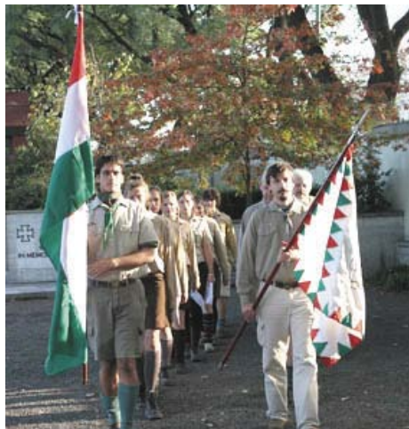
Hősök napja: Zászlók kivonulása