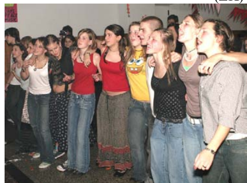
A BOLDOG fanklub