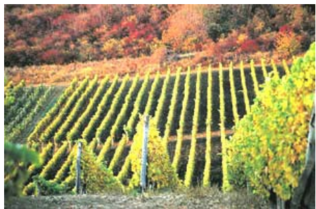
Viñedos del Tokaj...

En la edad media el vino era una de las mercancías más importantes. Los grandes cultivos se encontraban fuera de las murallas de las ciudades y poblados, cuyo desarrollo dependía mucho de las buenas cosechas. Los ciudadanos, los artesanos y la sociedad en general vivían en gran medida de estos ingresos.