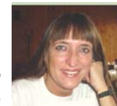
Compilado por Henriette Várszegi