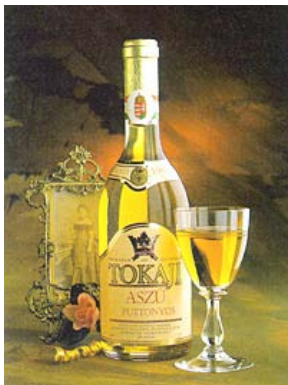
...y el producto terminado

El Tokaji Aszú , vino dulce, vino generoso de postre por excelencia, también conocido en español como "vino de lágrima". Este noble vino fue producido por primera vez hace 450 años por un clérigo llamado Máté Szepsy-Lackó. Para su producción se usa el fruto de la vendimia tardía (entre octubre y diciembre) cuando la uva ya tiene un contenido muy alto de azúcar, además de un hongo adherido a ella llamado "botrytis cinerea". Estas dos condiciones hacen que este vino sea inimitable, ya que por su característica del alto contenido de azúcar es capaz de mantener un bouquet y gusto frutal y fresco. Su producción está estrictamente controlada. La marca puede ser usada exclusivamente por los productores reconocidos.