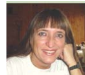
Compilado por Henriette Várszegi