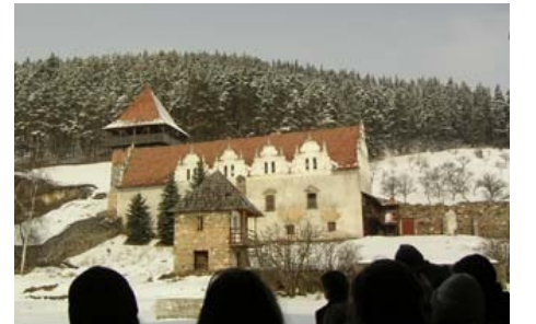
A Regőcsoport résztvevői csodálják a Lázár kastélyt...