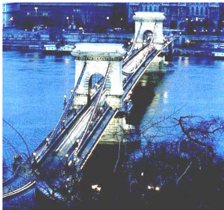
Aspecto nocturno del Puente de las Cadenas

Como toda adolescente, soñaba con irme a descubrir aquellos lugares de los que sólo había oído hablar en televisión o leído en el diario. Con 18 años partí a Hungría, para pasar un año como estudiante de intercambio. Todos pensaban que no "sobreviviría" más de un mes y se preguntaban qué podía hacer allá. Salí con la idea de que la gente iba a ser fría, pero al llegar me di cuenta de que no era como pensaba