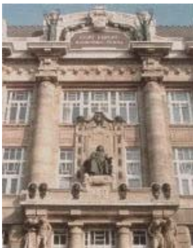
Fachada de la Academia de Música Ferenc Liszt, Budapest

El escalón siguiente es el universitario. Éste