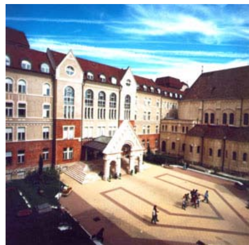
Universidad de Pécs