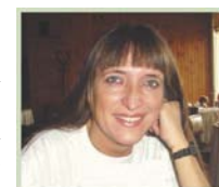
Compilado por Henriette Várszegi

Si escuchamos con atención los medios de comunicación, en múltiples formas toman como válido tener como meta "cómo pasarla mejor, aportando, si es posible, poco y nada". Nos convencen de que ante un mundo estresante nos merecemos ese viaje, ese spa , y todo tipo de relax . Y no estoy en contra del merecido descanso, pero que sea el séptimo día - ¡y que los otros días se dediquen al trabajo!