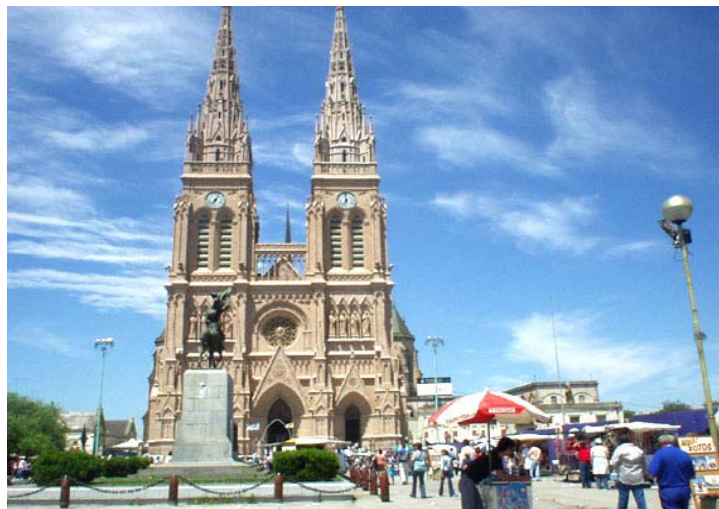
La imponente Basílica de Luján, adonde afluyeron los húngaros de la Argentina, junto con las autoridades de la colectividad

su único hijo, ofreció la Sagrada Corona a la Virgen, poniendo la suerte de todo el pueblo húngaro en Sus manos, tal como se ve también en el cuadro presente.