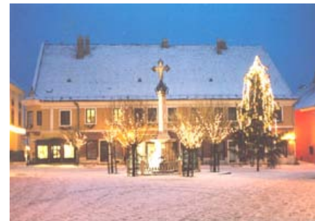
La misma plaza, con el toque mágico de la nieve recién caída y el Árbol de Navidad comunitario

Lamentablemente, la fuerte influencia de la TV aquí también se hace sentir y gracias a ella muchas familias se dejan llevar por el alocado consumismo. En la capital ya se han implantado costumbres bastante americanizadas.