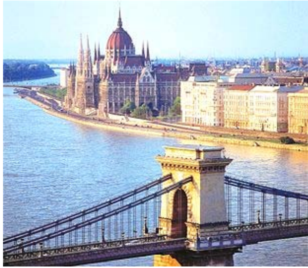
Puente de las Cadenas sobre el Danubio. Atrás, el Parlamento

Hay que decir que la ciudad no deslumbra pero tiene la belleza de los contrastes. Que el Danubio no es azul. Que está lleno de japoneses. De italianos. Y de españoles. Que los húngaros se empeñan en hablar y escribir en húngaro cuyo alfabeto se amplía por los