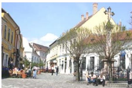
Plaza principal de Szentendre, preparándose para el verano

Szentendre está a 20 km al norte de Budapest, sobre la margen derecha del Danubio y enclavada en uno de los más pintorescos y hermosos valles de los montes del Pilis.