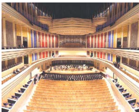
La sala de conciertos