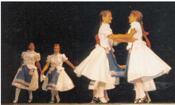
Buenos Aires-i új "Pacsirta"