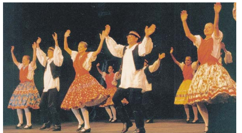
São Paulo-i "Pántlika"