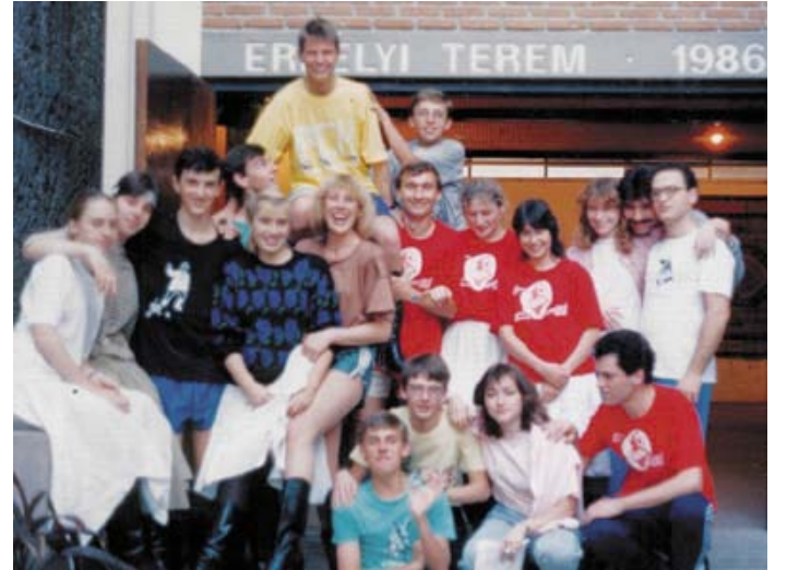
São Paulo – edzés után

Miért lett volna kevésbé izgalmas az 1992-es uruguayi találkozó?... Többek között "csak" azért, mert Buenos Aires néptáncosai (akkoriban született meg a "Pacsirta" együttes) majdnem szintiszta új-fiatal tagozattal léptek fel, a már begyakorolt braziliai és uruguayi együtteseivel szemben. Azért megálltuk a helyünket, és később azok a táncszámaink hatalmas sikerszámokká fejlődtek ki (Sárközi karikázó, csárdás, verbunk és mars; Szatmári verbunk csárdás és friss, illetve a felejthetetlen Kalotaszegi bál). A szimpóziumot Román Sándor tartotta (Honvéd együttes, Budapest).