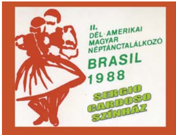
Brazília 1988 plakátja

Másrészt, egy ekkora szervezés igen sok anyagi szükséglettel jár! Ennek a fedezésére a kiválasztott színházat meg kell tölteni lelkes, folklórt szerető nézővel, a műsorfüzetet pedig jó kövérre tömni hirdetéssel! Ezekon kívül, a sok vendégtáncost el kell szállásolni, kosztoltatni, szállítani-sétáltatni, és úgy eresztetni haza, hogy minden téren meggazdagodva, meggyőződve kijelenthesse: "de remek volt a találkozó!"