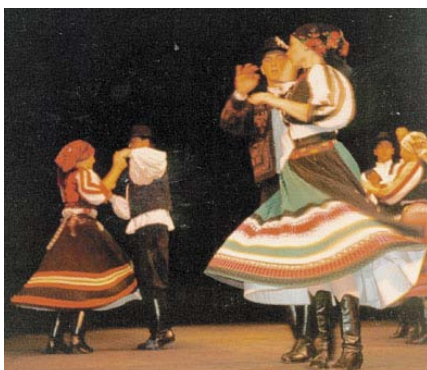
São Paulo-i "Zrínyi"