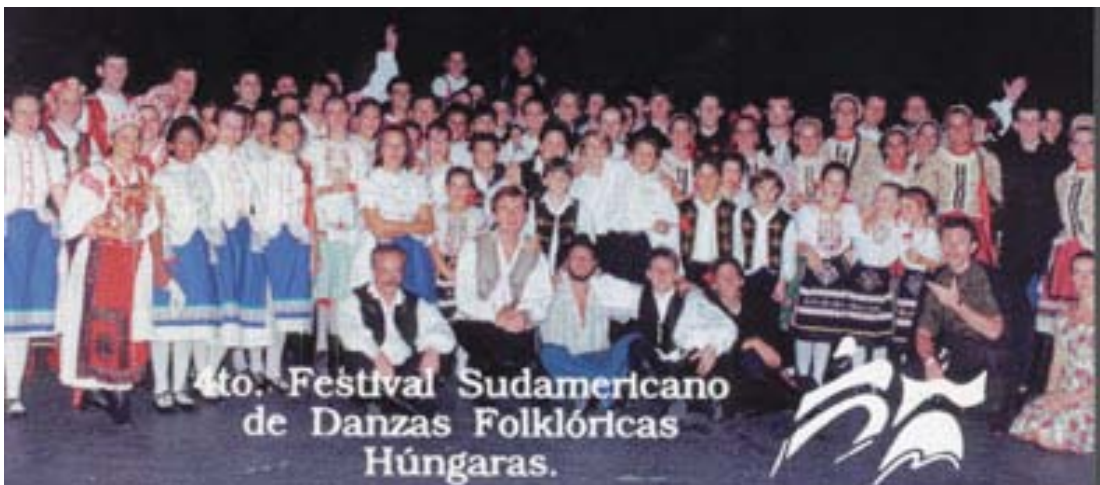
Uruguay 1992: Záró a színpadon

A találkozók céltudatosan indultak. Több ágú lombos fácskánkra kell vigyázzunk mindnyájan. Ha öntözzük, nő és nő, szebbnél-szebb lesz, mint közös munkánk fokozatos tükre. Azért csináljuk, hogy fejlődjön szaktudásunk, azért, hogy gyönyörű barátságunkat tápláljuk minden újratalálkozással, hogy megmutassuk, mit érünk el a rendszeres foglalkozással.