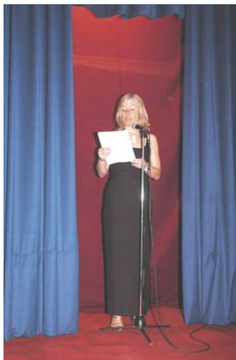
Lajtaváryné ügyesen levezeti a műsort