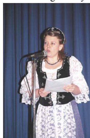
Haller Ines hangot ad szép spanyol- nyelvű köszöntőjének