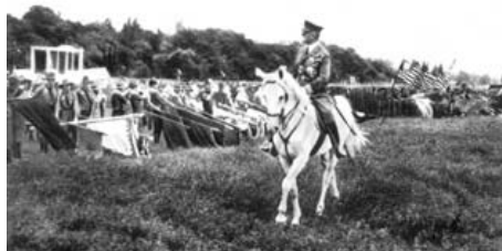
Nagybányai vitéz Horthy Miklós, Magyarország kormányzója a gödöllői világ-dzsembori megnyitó ünnepélyén