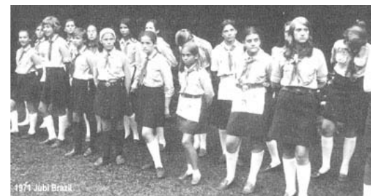
1971 Jubi Brazil