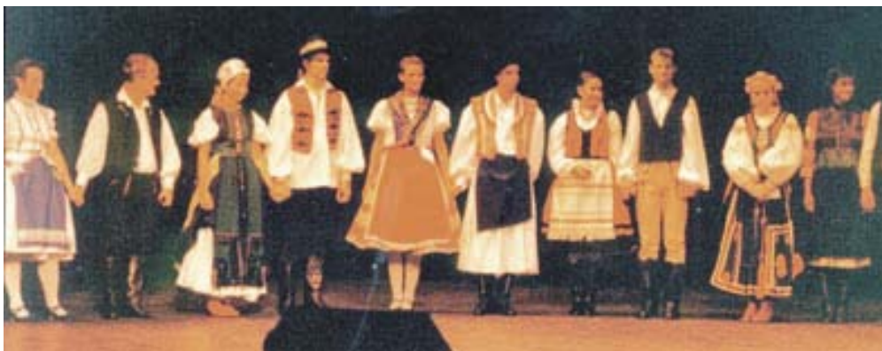
Uruguay 1992: Találkozó nyitója