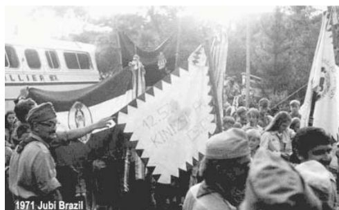
1971 Jubi Brazil

Ez volt az én nemzedékem első ilyen “tömeg”-cserkész-táborra. Felmérhetetlen élmény volt, annyira, hogy sokszor még emlegetjük! Most, hogy én is nézem ezeket