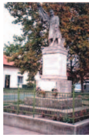
... és Kocséron

Pl. a gödöllői áldozatoknak emléket állító szobor (1931) Siklody Lőrinc alkotása. Az áldozatok névsorát a szobor talapzatán örökítették meg. 1990 októberében került vissza jelenlegi helyére, a Szabadság térre.