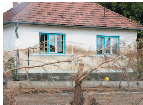
Ajtón-ablakon át ömlött be a víz