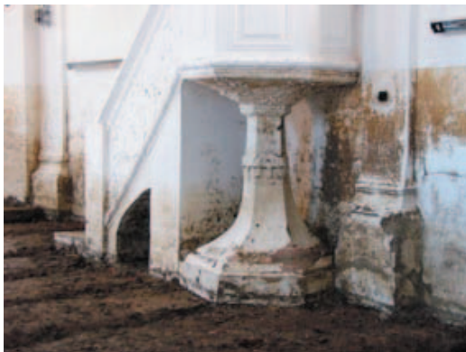
Itt a szőszékig ért a víz