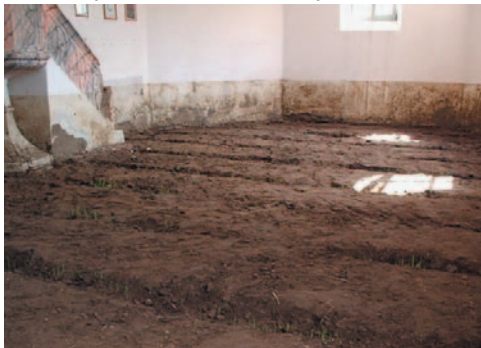
Református templom, Bikafalva

Én nem ismerek pontos adatot, de 15 falut biztos érintett és Székelyudvarhelyt - ez utóbbiban hamar helyreállt a rend a helybeliek, és a kívülről jött