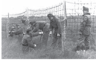
Drótakadály a határon

- Gyorsan dugd zsebre! - mondta a barátom. - Ha az asszonyok meglátják, azonnal visszafordulnak!