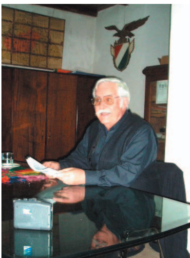
A vidám előadó