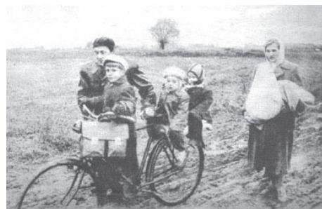
Családok is nekivágtak...

Hogy a rendőr elhitte-e, amit mondtunk neki, nem tudom. Kinézett az ablakon, s látta, hogyan veri a havas eső az üveget, hallotta, hogyan zörög a busz tetején, majd rápillantott terhes feleségemre és visszaadta az igazolványainkat.