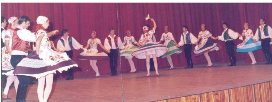
1986 (Buenos Aires) Regös az első dél-amerikai magyar néptáncalálkozón ( drágszéli játékok és Matyó menyegző )

Az első találkozón a REGÖS együttes serdülő és felnőtt tagozatai léptek fel (kb. 40 néptáncos), hol külön-külön, hol merész, tömeges táncszámokkal. A két estét betöltő műsorunk ez volt: