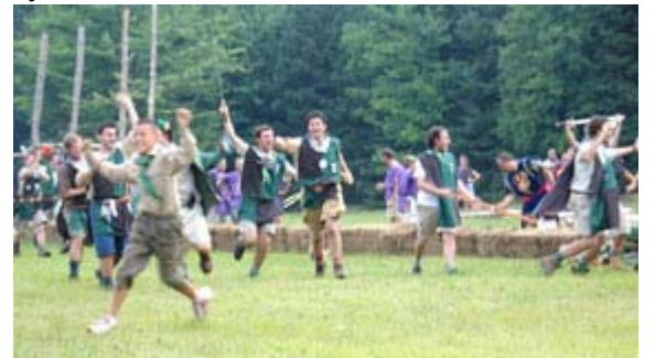
Fiú I altábor