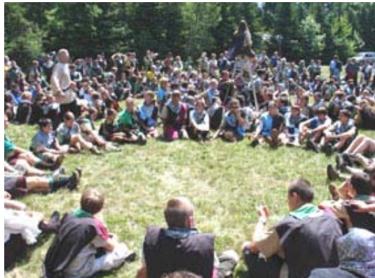
Körbeüljük a játékot

használtak szögeket, s ez nem kis teljesítmény. Délután Nagy Lajos és udvara-korabeli jelmezekben, díszletek közt zajlik a lovagi torna. Az akadályverseny alatt kisebb baleset