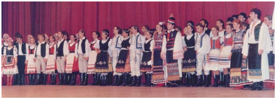
1986 (Buenos Aires) Záró az összes együttesel