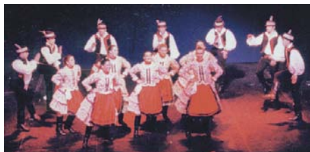
1995 (Buenos Aires) Regös az ötödik dél-amerikai magyar néptáncalálkozón ( Szatmári finale és Kalotaszegi bál )