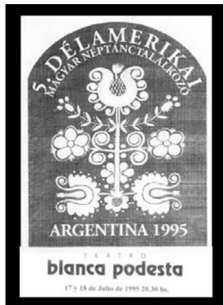
A két Buenosban megtartott találkozóznak műsorfüzetei és egyben a rendezvények "logo"-i