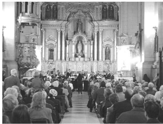
A szlovén kórus FOTOMARKO

Könnyeim letöröltem és reméltem, hogy nemsokára következik a várva várt Coral Hungaria. De előbb még egy, vagy húsz perces