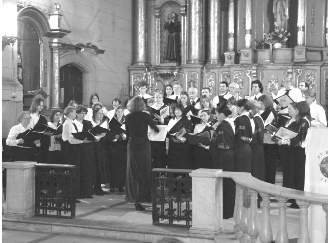
Coral Hungaria FOTOMARKO

zenekritikus, Pablo Kohan már írt erről egy igen elismerő cikket a La Naciónban Encuentro con la tradición y la emoción címmel (amit minden zenebarát és főleg a koncert magyar és szlovén