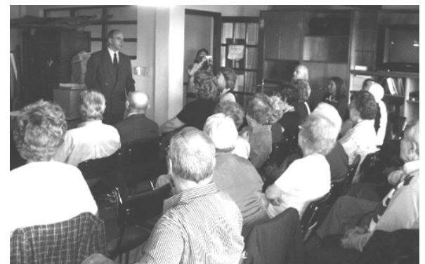
A hallgatók egy része

Látszott rajta, hogy nemcsak mint diplomata, hanem mint egyetemi tanár is hozzá van szokva, hogy értelmesen ismertesse és bizonyítsa témáját. A logika módszerével, következetesen bebizonyította, hogy az embert öfenntartási ösztöne, környezete és körülményei vezették arra a felismerésre, hogy erejét egy felsőbb ERŐ segítségével tudja csak fenntartani. Szüksége van egy kapcsolatra az ERŐFORRÁSSAL. Ezt a kapcsolatot csak a HITTEL és teljes bizodalommal lehet megteremteni, vagy megtalálni. Ezek után nagyon élénken elmagyarázta, hogy - ennek logikus következményeképpen - hogyan keletkeztek a vallások, majd a mindenkorai vallásoknak milyen hatása és befolyása volt és van a társadalom, szokások, erkölcsök kialakulására. Előadásának utolsó pár percében felsorolta a DEMOKRÁCIA megmásíthatatlan feltételeit.