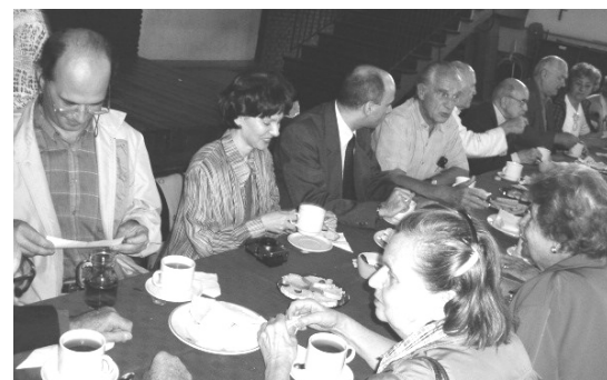
Utána tea!