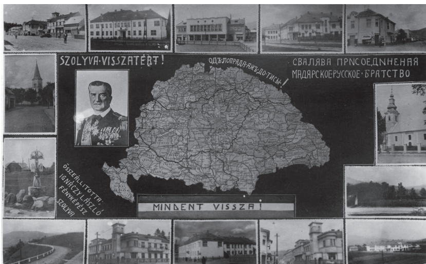
Az anyaországhoz történt visszatérésre kiadott képeslap. A szolyvai Országzászló.

Az ünnepség este a Magyar Házban 200 teritékes bankettel ért véget.