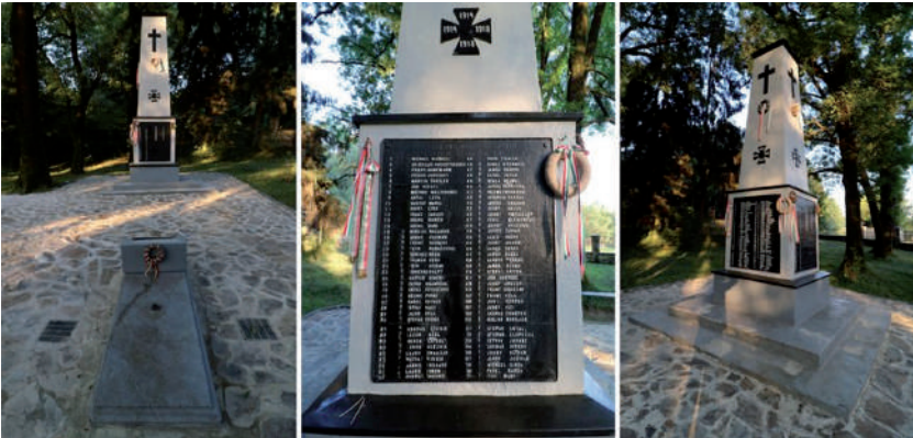
Az I. világháborús emlékmű és annak egyik táblája 2017-ben.

Az obeliszk állításának a pontos dátumát sajnos nem tudtuk megállapítani. A szovjet korszakban talán hatósági utasításra, esetleg ösztönzésre, de