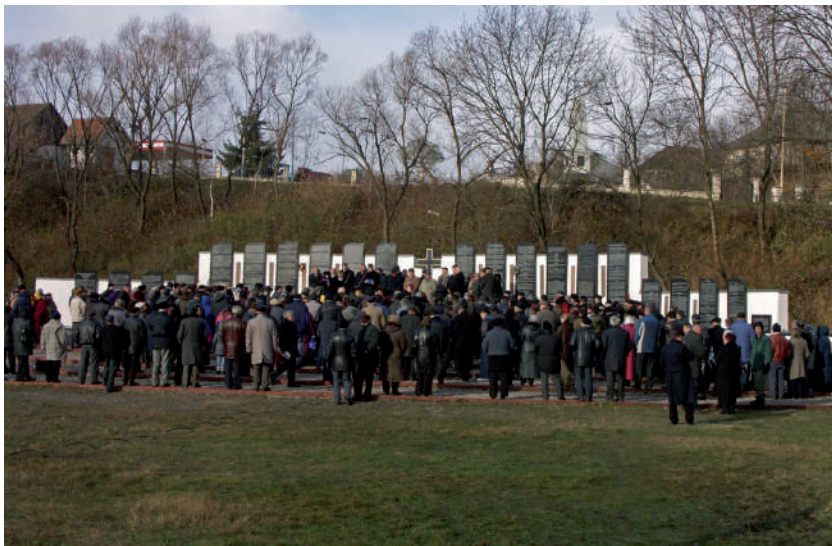
Megemlékezés 2008-ban.

2017-ben az emlékfal külső oldalára 14 nagyméretű molinót erősítettek fel. Ezeken három nyelven – magyarul, ukránul és németül – ismertetik a szovjetek által elkövetett szörnyűségeket, képes beszámolót olvashatunk Kárpátalja magyar lakosságának 20. századi tragikus történetéről, valamint az e téren folyó kutatásokról. Ugyancsak felkerült az emlékfal hátsó oldalára Kárpátalja szovjet terrorjának emléktérképe, melyet Dupka György adatbázisának felhasználásával jelen sorok írója szerkesztett. Ennek segítségével térben is elhelyezhetjük az eseményeket. Az azóta már három kiadást megért papíralapú térképet széles körben terjesztik az érdeklődők körében.