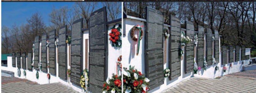
Az emlékfal központi része és egy települési tábla. Az emlékfal táblái.