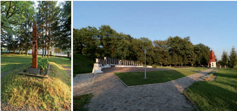
Az előkerült csontok sírhantja a kopjafával. Az emlékpark 2017-ben.

2016. december 7-én az emlékpark újabb emlékjellel bővült. 70 évvel azelőtt ezen a napon végezték ki Bródy András magyar országgyűlési képviselőt és társait. Ennek emlékére szentelték fel az elhurcolt és kivégzett magyar országgyűlési képviselők, felsőházi tagok emlékművét, Mihajlo Beleny alkotását.