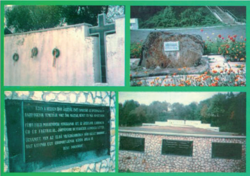
A szerző által 1997-ben kiadott képeslap

valakit, és az is, aki elítéli az ehhez hasonló gaztetteket. Sajnos az ukrán állam hivatalosan a mai napig sem foglalt állást ebben a kérdésben, nem kért bocsánatot az áldozatoktól és hozzátartozóiktól, sem erkölcsileg, sem anyagilag nem kárpótolta őket. Egyetlen pozitívum, hogy a Kárpátaljai Megyei Tanács elismerte a történeteket, és igyekszik a maga szerény módján kis segélyben részesíteni az áldozatokat.