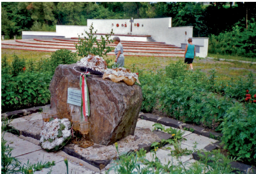
Az 1990-ben felavatott emlékkő, háttérben az emlékfal még táblák nélkül.

A Szovjetunió felbomlása és Ukrajna függetlenedése által okozott zűrzavaros állapotban, a mérhetetlen gazdasági ellehetetlenülés, a pénzromlás miatt az emlékpark építése helyi forrásokból már nem volt megvalósítható. Ezért a beruházás első üteme: az emlékpark dekoratív kerítése és a létesítmény központi elemének, az emlékfalnak a megépítése, már az anyaországi Illyés Közalapítvány hathatós támogatásának köszönhetően valósulhatott meg.