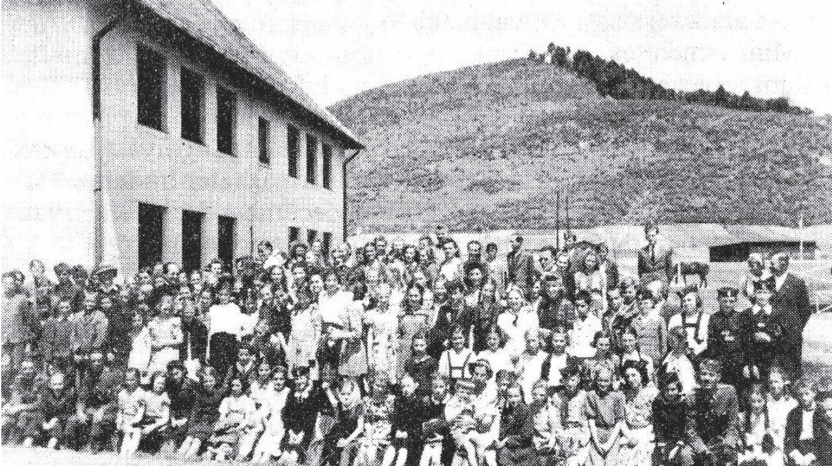
Az 1941-es kaszárnyaavatás résztvevőinek egy csoportja. (Kárpátalja, 1994. 12. 31.)

A szovjet megszállók forгатókönyvében fontos szerep jutott ennek a katonai laktanyának. A szovjet hadsereg itt alakította ki a GUPVI (ГУПВИ, Главное Управление По делам Военнопленных и Интернированных = Hadifogoly- és Internáltügyi Főhivatal ) 2. sz. SZPV gyűjtőtáborát (СПВ, Сборный Пункт Военнопленных = Hadifogolyok Gyűjtőpontja ). Ezenkívül Perecsenyben és Huszton is volt kisebb gyűjtőtábor, ahová a szovjet terjeszkedés potenciális ellenzőit, elsősorban a magyar és német férfilakosságot internálták. A táborokban az ártatlanul összegyűjtött emberekre elképzeltetlen sors várt: metsző hideg és kritikán aluli higiéniai körülmények. Mindezekhez társult az éhezés – élelmezésüket a benzines- vagy olajoshordókban főtt borsó-, kukorica- vagy marharépaes, néha 20 dkg kenyér jelentette.