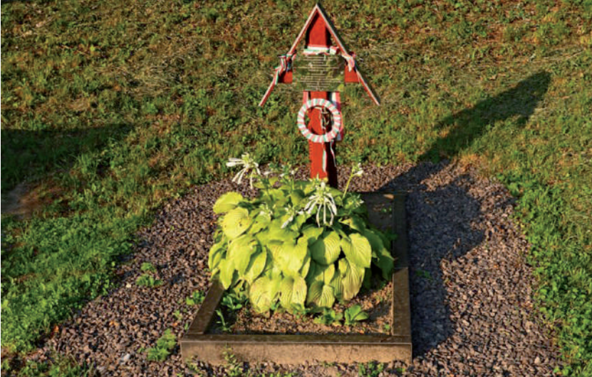
A hat honvéd sírja.