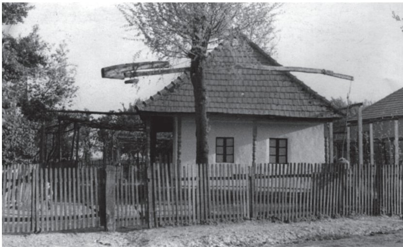
Tornácós ház léckerítéssel, élőfára szerelt gémeskúttal (Salánk, 1960-as évek)