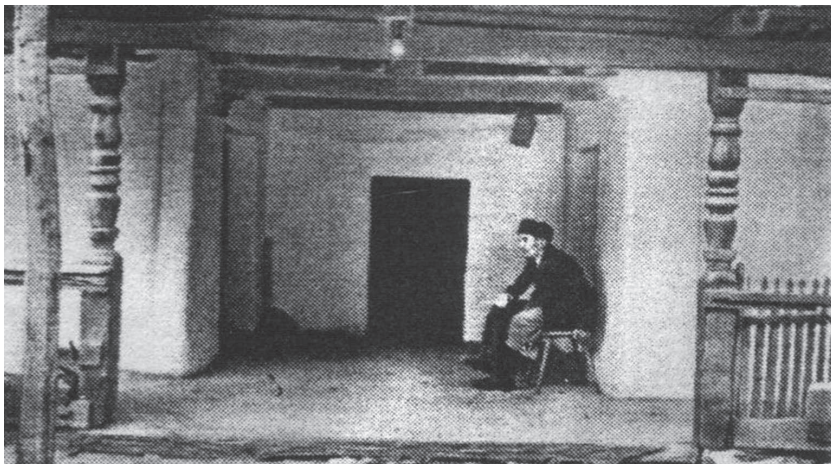
Salánki nyitott pitvar (Fotó: G. Szpirin, 1969)