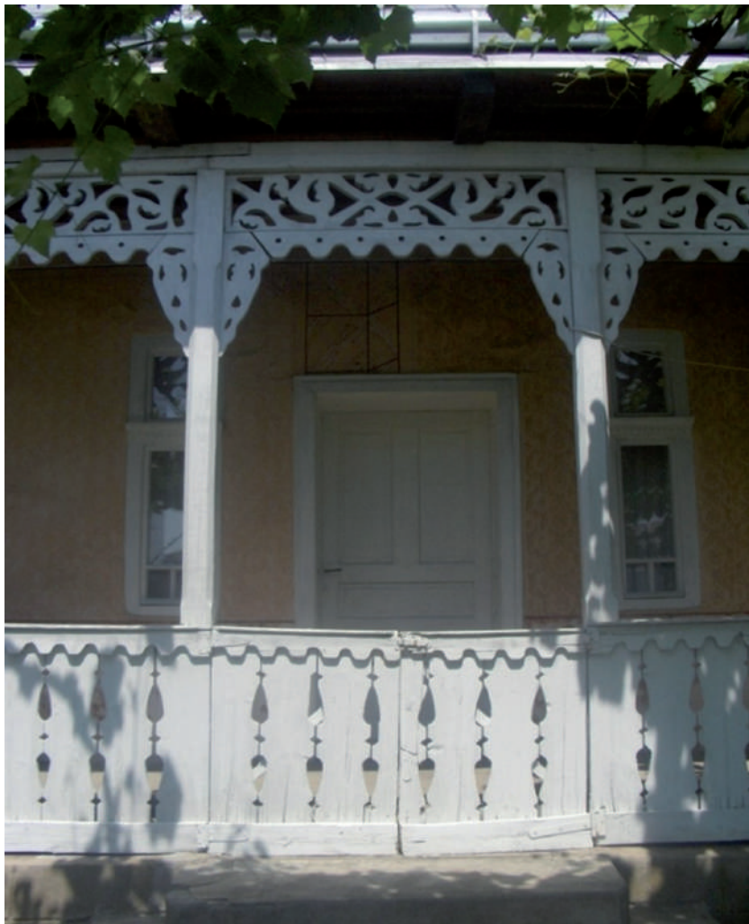
Áttört faragású tornác feljárata (Fotó: Kész B., Salánk, 2010)