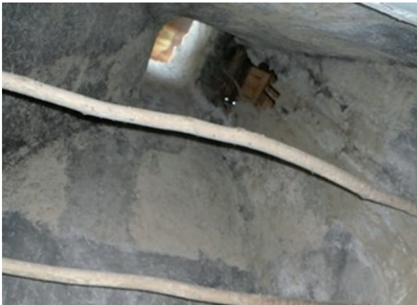
Nyitott kémény, farkasfalvi skanzen