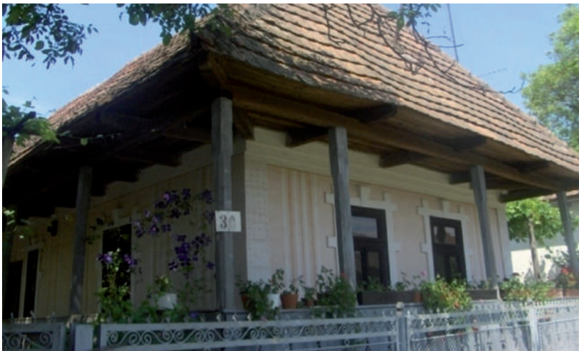
Takáros körtornácos ház