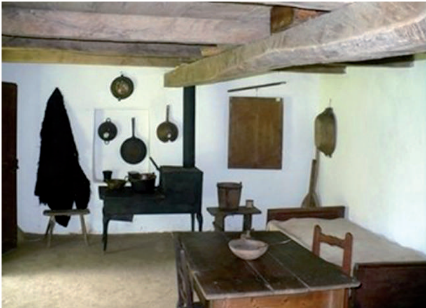
Szegényparaszt házának konyhája a mestergerendával, farkasfalvi skanzen