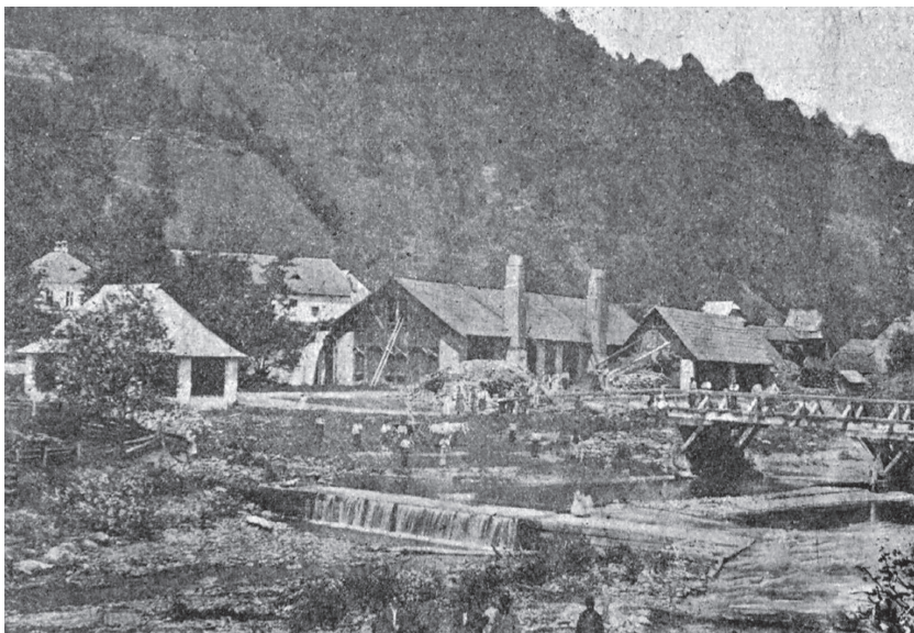
A kabolapojanai vasgyár. (Várady Gábor: Máramarosi emlékkönyv, M. Sziget, 1901.)

A település hírnevét egy vasgyár alapozta meg. A máramarosi sóbányák vaseszközszükségleteinek biztosítására, a szállítási költségek megtakarítása végett, a kincstár megpróbálta kihasználni a környék adottságait. A vidéken Lonkán, Rahón, Kaszópolyanán, a Mencsil-hegyen és Kabolapolyanán vasérclelőhelyekre bukkantak. Kabolapolyanán például 20 font ércből 13 font nyersvasat lehetett nyerni. Azonban volt egy probléma. „A közelben bányászott kabolapolyánai ércek bőségben álltak ugyan rendelkezésre, jelentős vastartalmuk mellett kitermelési költségük sem volt magas. Viszont nehezen