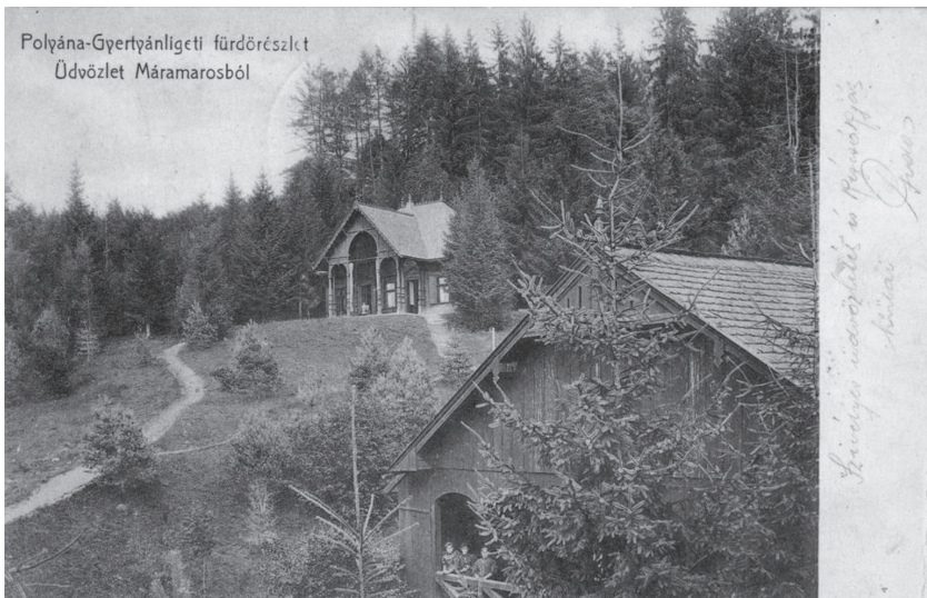
Egy 1904-ben feladott képeslap.