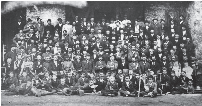
Vasgyári csoportkép.

Az olvasztó azonban nagyon hamar tönkrement. Ekkor a Vajdahunyadból hozott öntömester irányításával a Krajna-patakra új olvasztót építettek, de ez