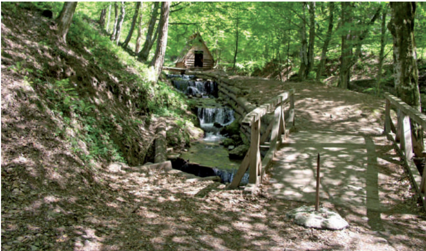
A gyertyánligeti fürdő helyszíne 2005-ben.

Sajnos az első világháborúban a betörő cári orosz hadsereg kozákjai a gyertyánligeti fürdőt felgyújtották és lerombolták. A cseh uralom pedig sorsára hagyta, az épületek maradványait a lakók széthordták. Az 1940-es években az erre kirándulók már az épületek romjait sem találták meg. Azóta a híres fürdő már csak az emlékekben él.