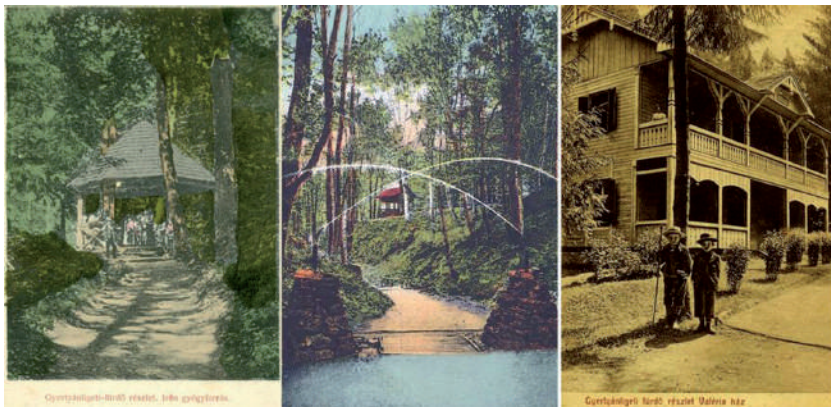
Régi képeslapok a gyertyánligeti fürdőről.

... a Sopurka partjain halad kocsink, gyönyörű rétek, erdős-bokros dombok közt, míg egy hirtelen emelkedőn felkapaszkodva, előttünk áll a fürdő. Elöl óriás hársak árnyában kétsor apróház; ebben az itteni kincstári vasgyár szegverői laknak; de ilyenkor mind vendégek lepik el ezeket az épületeket is. Aztán következik a főépület előtte magasra ugró természetes szökőkuttal. Ez a vendégek időmérője. A vastag vizsugár rossz időben leesik; szép, meleg idő előtt magasra szökelve tör elő. Feljebb, susogó fenyők között maga a gyógyforrás van. A forráshoz vezető uton kőpadok vannak lombos fák tövéhez illesztve. Itt egy nagy kő, rajta felkioszorozott kettős vaskereszt. A rege szerint egy szorgalmas munkást temetett maga alá a roppant sziklatömb. Mindjárt fölötte van a diadalív, mely két szemben álló vascsőből elötörő vizsugárból képződik.”