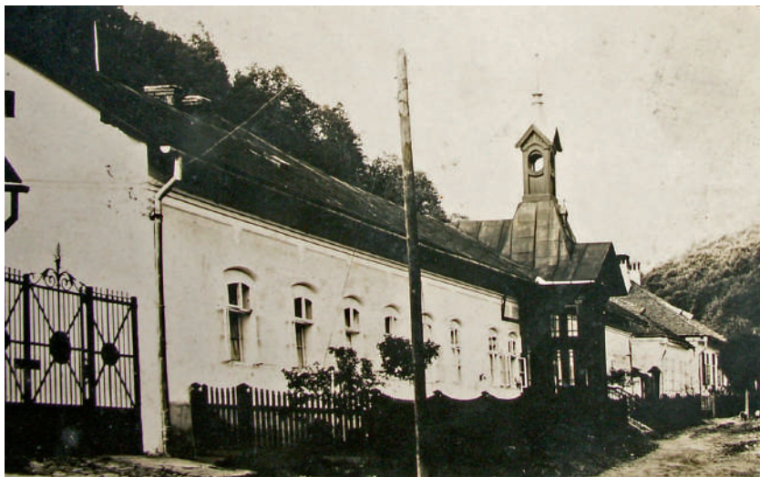
A gyertyánligeti vasgyár irodaépülete.

Kezdetben egy kisolvasztóból – valószínűleg csak bucakemencéből – állott, hetenkénti 35 bécsi mázsányi (1960 kg – KS) termeléssel és két nyújtó-hámorból a termék feldolgozására.