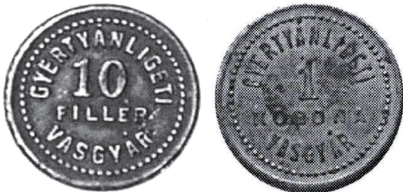
A gyertyánligeti vasgyár 10 filléres és 1 koronás bárcája. (Éremtani Lapok 2003/8. és 2005/8.)

Ebben az időben a gyár, hasonlóan a kor egyes uradalmihoz és bányáihoz, munkásai számára saját pénzt (bárcákat) hozott forgalomba. Ezekkel a gyár fennhatósága alá tartozó üzletek és egyéb intézmények szolgáltatásait lehetett igénybe venni. A sárgarézből készült bárcák közül ma az 1 koronás és a 10 filléres érme ismert. Minden valószínűség szerint a bárcák az első világháború végéig voltak forgalomban.