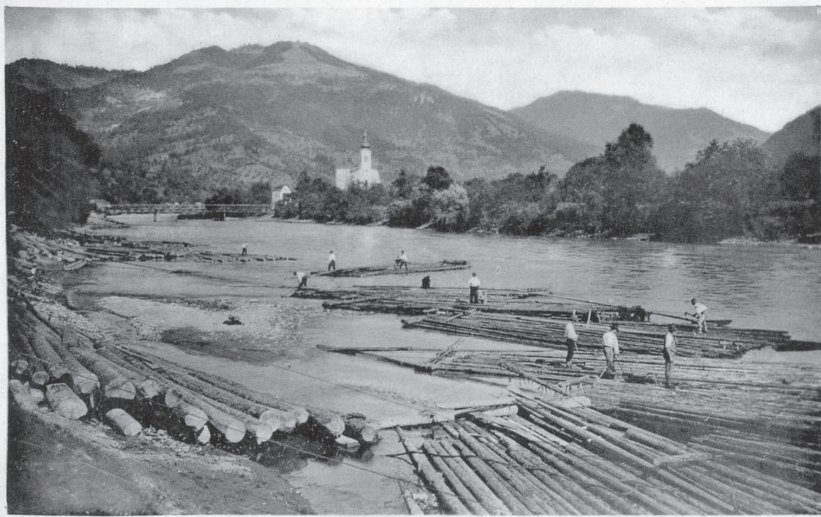
Tutajok rendezése Nagybocksó és Tiszalonka között. Háttérben a lonkai Tisza-híd és a román oldalra szakadt templom.