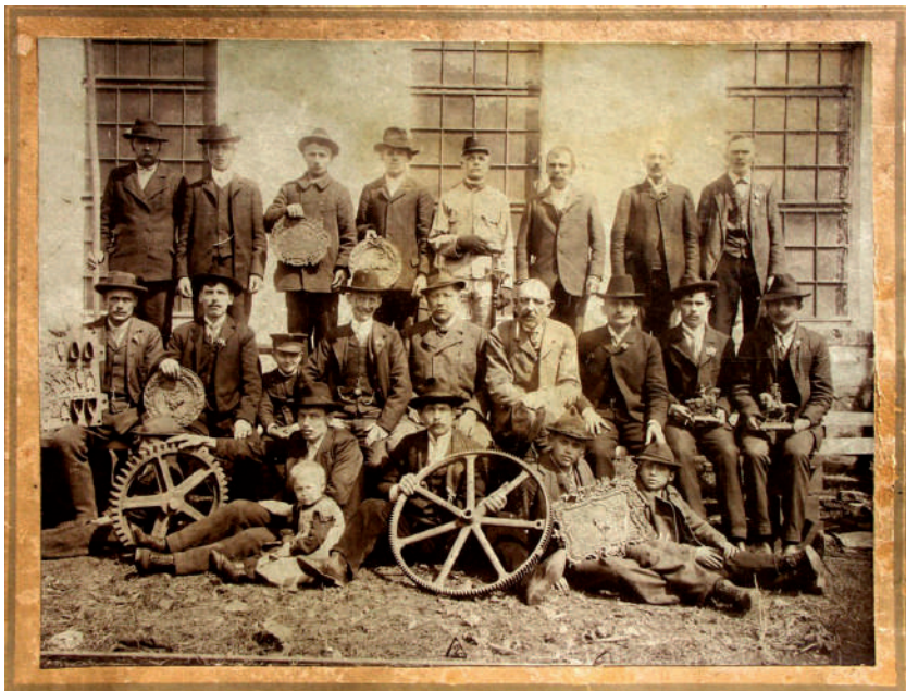
A vasgyár alkalmazottai néhány termékükkel.