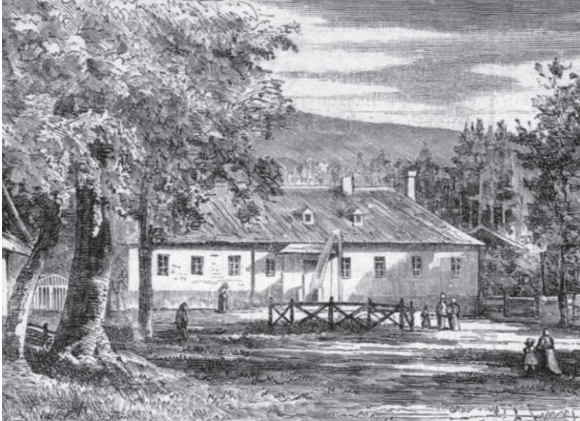
A gyertyánligeti fürdő az 1880-as években. (Vasárnapi Ujság, 1882/39.)