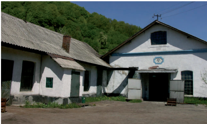
A gyertyánligeti vasgyár egyik épülete 2005-ben.