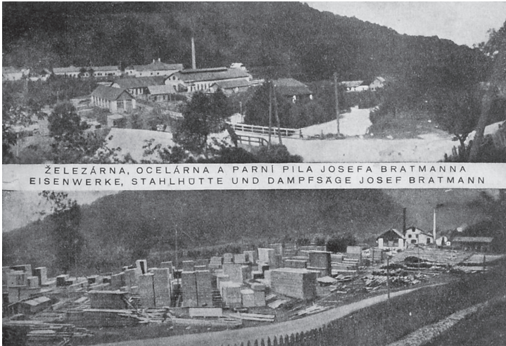
Képeslap a cseh érából a vasgyárral és fűrészüzemmel.