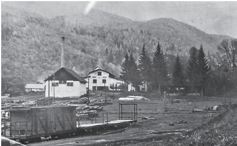
A gyertyánligeti vasgyár a szovjet korszakban.