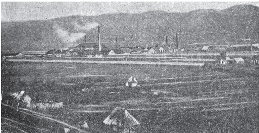
A nagybecskői gyár

1880-tól a bocskói gyár szárazfalepárló üzemmel bővült. A fa jelentős részét a Gyertyánoson úsztatták le, és a gyár előtt gerebekkel fogták fel. A fa kémiai feldolgozásából mintegy 40 féle termék nyerhető, és tulajdonképpen semmi semvész el, minden értékesíthető. A gyár termékei között volt: timsó, klórmész, keserűsó, rézgalic, finomított salétrom, salétromsav, sósav, kénsav, szóda, kénsavas agyagföld, ecet-eszencia, ecetsav, jégecet, faecet, faecetsavas vas, faecetsavas mész, aceton, faszesz denaturáláshoz, finomított valamint nyers faszesz, metilalkohol, kovácszsurok, fakátrány, kátrányolaj, bükkfaszén, samott téglá, samott liszt és saválló edény.