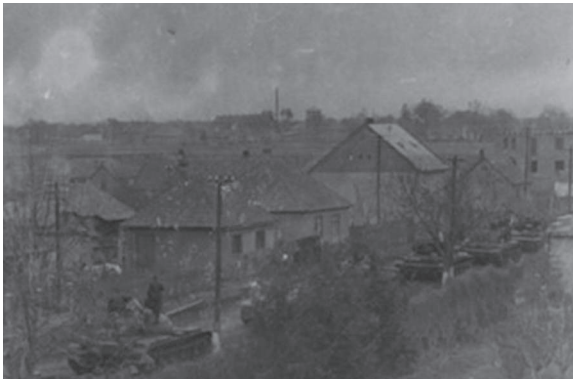
A beregszászi Macsolai utcán vonulnak át a harckocsik a magyar határhoz, 1956.

A háborús hangulatot tükröző látvány és a magyar szabadságharcosok ellen indított szovjet hadművelet sokakat felháborított, egyeseket sajátos ellenállásra készítetett. Végül Kárpátalján is megtörtént a példát statuáló leszámolás: a lehetetlenre vállalkozók, illetve a rendszert bírálók közül – az alábbi lista tanúsága szerint – sokan a szovjet ügynökök, a hatósági megtorlók karmaiba kerültek. A szovjetellenes tevékenység és hangulatkeltés ügyében elítélteket 1991–1998 között rehabilitálták.