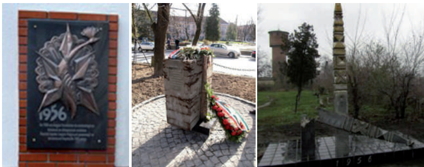
1956-os dombormű-emléktábla az ungvári börtön falán.

A jubileumi emlékjelek állításának programja keretében Magyarország Ungvári Főkonzulátusa szervezésében és a Határon Túli Magyarok Hivatala, valamint a Nagy Imre Társaság közreműködésével újabb emléktáblát avattunk az ungvári börtön falán, a Magyarországról a Szovjetunióba deportált több mint 760 hazafi tiszteletére.