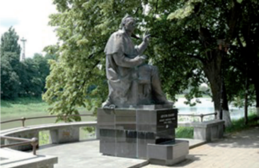
Volosin bronzszobra Ungváron, az Ung partján.

Európa legerősebb, legtekintélyesebb állama, amelynek politikai támogatását több ország szeretne volna a magáénak tudni, vagy vele esetleg politikai szövetségre lépni. Nem volt kivétel e tekintetben sem Magyarország, sem a Szovjetunió, sem pedig Kárpát-Ukrajna. Ami Avgusztin Volosint illeti, az ő rehabilitációjára csak 1991 szeptemberében került sor.” 34