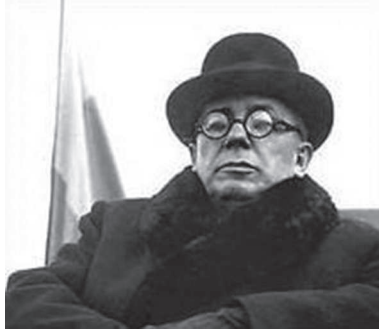
Avgusztin Volosin letartóztatása előtt.

bory Emma. Édesapja, Volosin János ruszin származású, ekkor kelecsényi görögkatolikus lelkész, felmenői nagylucskai előnévvel a magyar nemesi rangot is kiérdemelték. Az apa által anyagilag támogatott fiú az ungvári magyar gimnáziumban érettségizett, teológiai tanulmányait a budapesti egyetemen kezdte és az ungvári papi szemináriumban fejezte be. 1897. március 22-én szentelték görögkatolikus lelkésszé, és Ungváron a ceholnyai görögkatolikus templom káplánja lett, ahol magyar nyelven is tartott szentmisét.