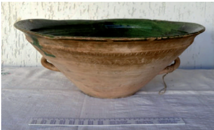
Nagyméretű, zöld mázas cseréptál. Tészta keltetésekor, mosogatáskor és egyéb alkalmakkor használták. (Fotó: Kész B., Salánk, 2016)