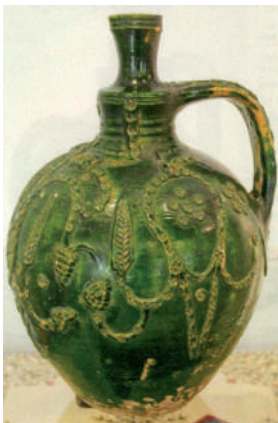
Úrasztali kanna Salánkról, Mátészalka 4.