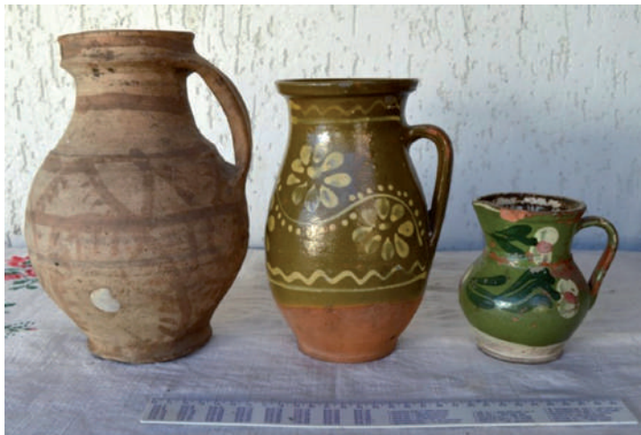
Tejes csuprok. A tej megaltatására használták.