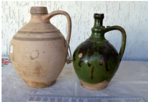
Vizeskorsók: a bal oldali mázatlan, a kisebbik zöld mázas. (Fotó: Kész B., Salánk, 2016)

A Kresz Mária által ismertetett korsó emberalak vonásai, az antropomorf díszítés stílusa alapján feltételezhetjük, hogy az alábbiakban bemutatásra kerülő, embert megragadó medve formájú dohánytartó edényt is Tangel József készíthette, bár az utóbbin nincs név és évszám.