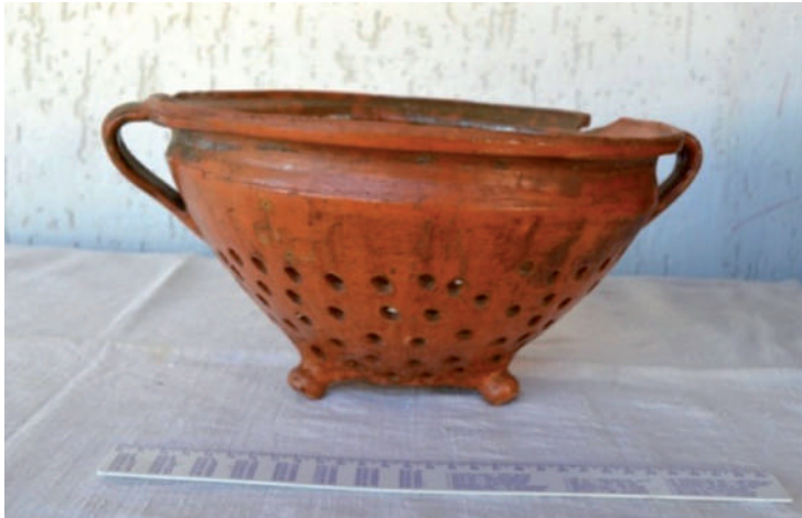
Nagyméretű cserépszűrő (Fotó: Kész B., Salánk, 2016)