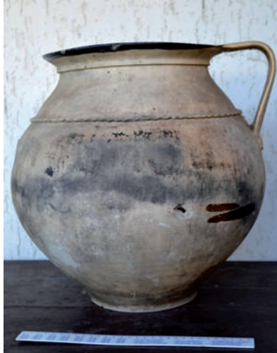
Cserépfazék (nagyfazék, lakadalmos fazék).

Kívülről mázatlan, belül mázas, nagyméretű, tűzálló főzőfazék, rátétes, bevagdalt zsinórutáncatú szalagdísszel, a fül alsó végénél erősítő célú ujjbenyomásos dísszel.