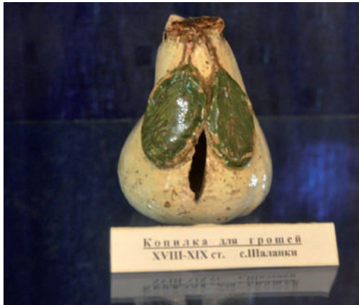
Persely a nagyszőlősi múzeumban. Salánk, 18–19. század

cserépedény közül néhányat a mellékelt fényképeken láthatunk, típusonként csoportosítva. 28 Azt megállapíthatjuk, hogy a cserépedények vöröses színe