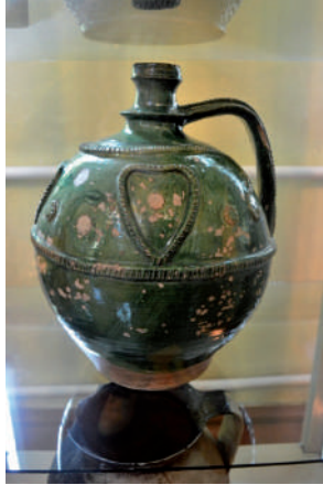
Zöldmázos butykoskorsó a nagyszőlősi múzeumban