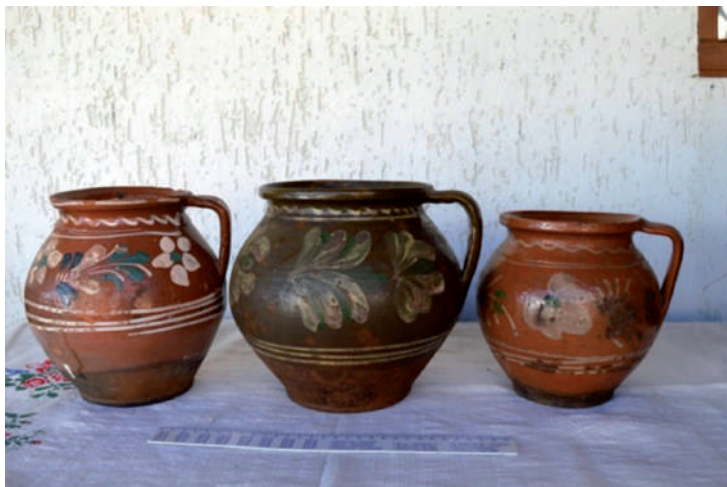
Szilkék. Ólommas cserépedények folytatott, elfuttatott, pötyyözött, virágozott, ecsettel, írókával festett, karcolt mintákkal. A széles szájú, öblös edényeket ételhordásra, aludttej vagy lekvár tárolására használták. (Fotó: Kész B., Salánk, 2016)