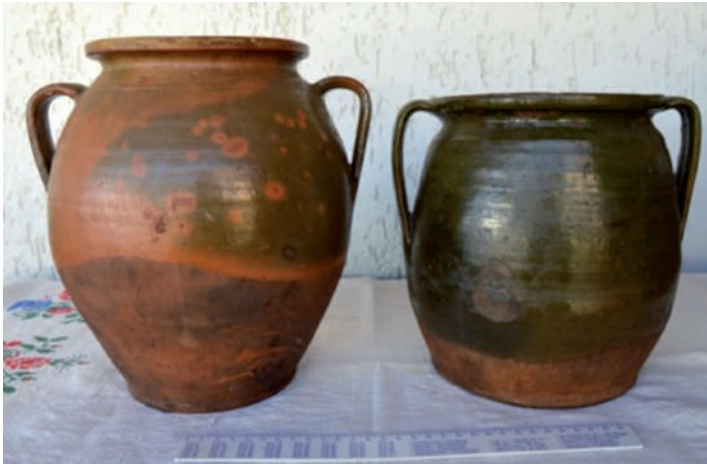
Fazekak. Ólommázás cserépedények (Fotó: Kész B., Salánk, 2016)

Kívülről mázatlan, belül mázas, nagyméretű, tűzálló főzőfazék, rátétes, bevagdalt zsinórutáncatú szalagdísszel, a fül alsó végénél erősítő célú ujjbenyomásos dísszel. (Fotó: Kész B., Salánk, 2016)