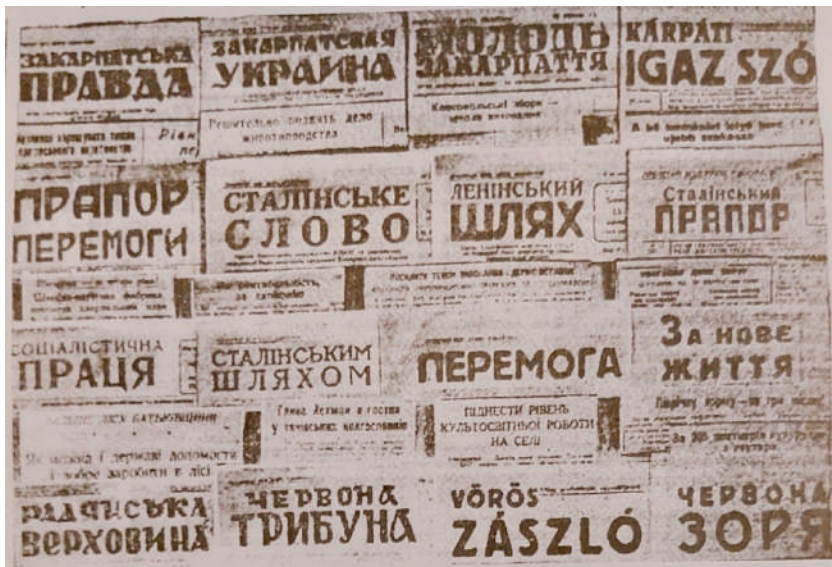
Az 1948–1955 között megjelent újságok Kárpátalján.

Keményen bántak el a lázadókkal 1948. október 9–15. között a técsői járási, ruszinok lakta Uglyán (Uhlja), ahol 13 lakost (főleg nőket) 2-től 25 évig