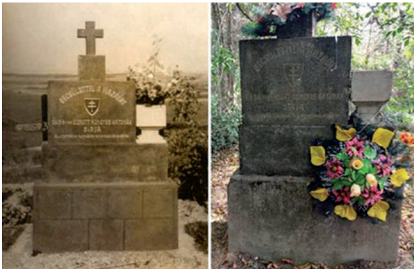
A csatában elesett rongyosok eredeti emlékműve és 2023-ban Fornoson.

Az emlékmű hiányosan és kissé kopott állapotban ma Fornoson, a falu régi temetőjében, a tó partján áll.