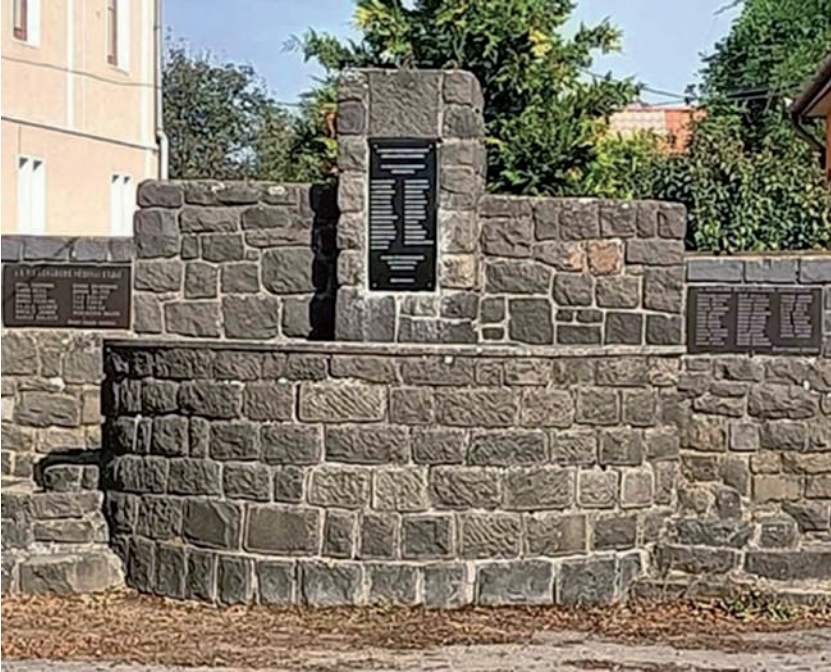
A szernyei helyreállított Hősök Emlékműve.

A szovjetrendszer idején az Országzászlót eltávolították, a Hősök Emlékművét lerombolták. Az emlékmű tábláját azonban a református lelkész megmentette és megőrizte. 1990-ben a helyi KMKSZ kezdeményezésére a falu központjában, eredeti helyén újjáépült a Hősök Emlékműve. Az Országzászló nem, de ez az új alkotás emléket állít a két háború és a szovjet terror szernyei áldozatainak. A kétoldalról lépcsővel ellátott ívelt mellvéd mögött öt részre tagolt lépcsőzetes emlékfal épült. A középső, legmagasabb, de egyben legkarcsúbb elem a fal síkjából is kiemelkedik. Ez tölti be a szimmetriatengely szerepét. Felső részére került fel a Hősök Emlékművének megmentett táblája. Két oldalon a szárnyak szimmetrikusan és lépcsőzetesen csatlakoznak a központi elemhez. A bal oldali, szélső falrészre erősítették fel a második világháború hős áldozatainak emléktábláját. Átellenben, a jobb szélen pedig a sztálini terror áldozatainak emléktáblája található. 2022-ben a Nagy Háború áldozatainak régi emléktábláját újra cserélték. Természetesen az eredetit a közösség biztonságba helyezte.