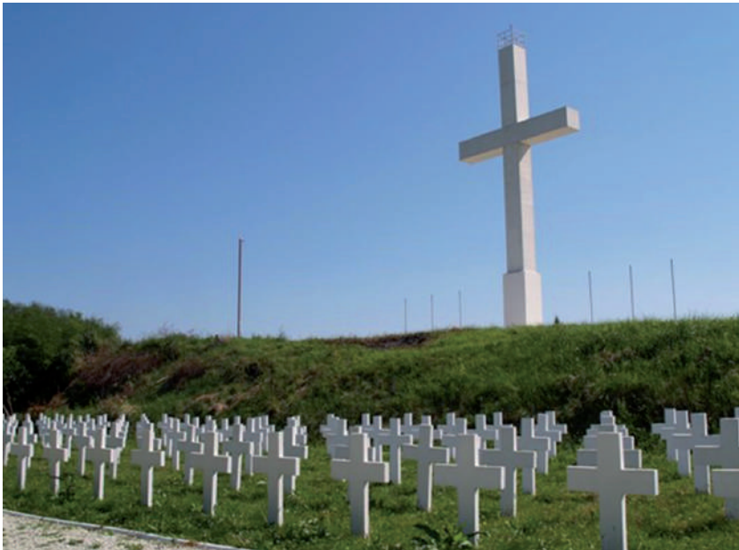
A készülő Magyar Katonai Temető 2011-ben.

Úgy tűnt, minden megy a maga útján. A felavatásra azonban nem került sor.