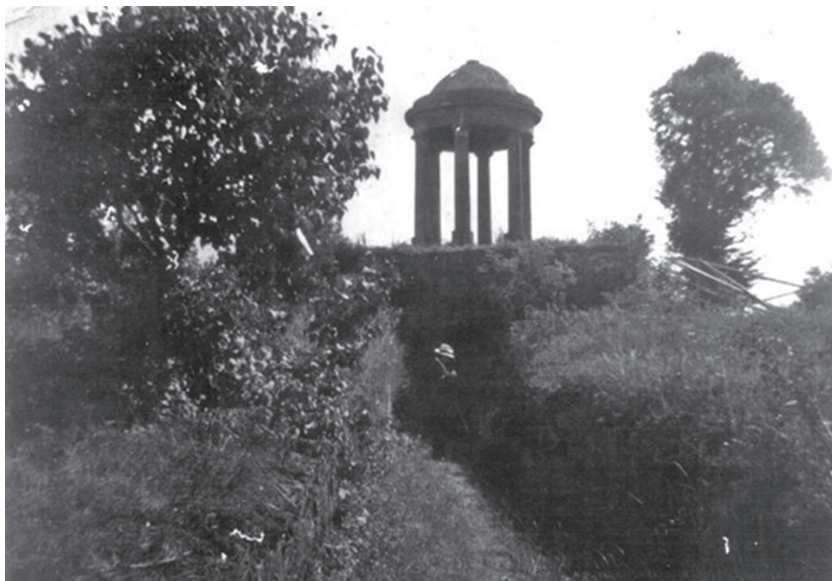
A kupolás Dercsényi-kripta.