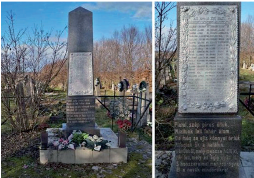
A derceni Hősök Emlékműve ma.

Botlik József a fentebb említett tanulmányában a temetővel kapcsolatban utal arra, hogy „Az 1970-es évek közepétől viszont államosították a zavaróállomás működését. Az első elmeneteliútkor a hatvanas évek fordulóján – a pontos időpontra már senki sem emlékszik – a falu népe néhány sírkövet leszállított és újra felállított az új temetőben.” Lajos Mihály a Kárpátalja című lap 2012. június 29-i számában pedig leírja az emlékmű megmentését is: „1951-ben lokátorállomást telepítettek a Temető-hegyre, az ottani temetőt teljesen feloldták, s pótolhatatlan veszteségeket okoztak azzal, hogy megsemmisítették a sírversekkel ékes fejjákat, valamint a Dercsényi család sírboltját (ahol addig többek között Kazinczy Júlia is nyugodott). Szerencse a szerencsétlenségben, hogy néhány bátor falubeli lakos egy éjszaka belopózott a szovjet hadsereg által ellenőrzött területre, szétszedték, s az új sírkertben felállították az első világháborús emlékművet, megmentve azt a biztos pusztulástól.”