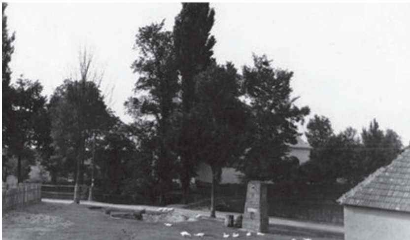
Az 1960-as években készült felvétel előterében a nagygyúti emlékmű látszik. Háttérben a fák takarásában a református templom.

„Légy hív mindhalálíg...” János. Jel. 2.1. 10v.