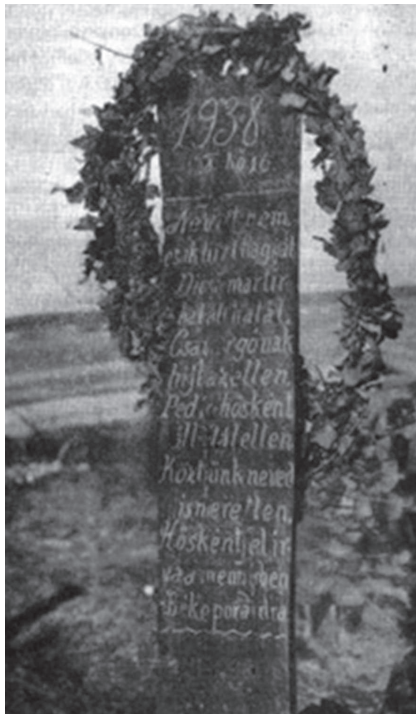
A rongyos kopjafa. A kép forrása: Az erdő útján. A Rongyos Gárda küzdelmei 1919, 1939. Magyar Ház, Budapest, 2000.