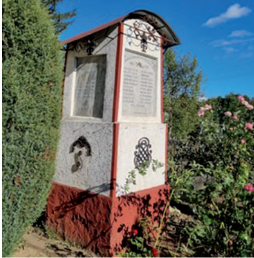
A felújított gúti emlékmű 2023-ban.

A szovjet berendezkedés után a hatóságok szemét szúrták az emlékművek, ezért a kiscigúti lerombolták, de a rajta lévő emléktáblát sikerült megmenteni. A kiscigúti emlékmű eredeti helye nehezen beazonosítható. A két község határa a templom környékén húzódott, az istenháza mindkét falut közösen szolgált. Ezért feltételezhető, hogy a kiscigúti emlékmű a templom e falurészbe eső oldalán volt.