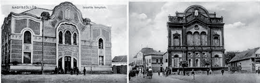
Az elkobzott zsinagógák Nagyszőlősiön és Beregszászban.

A kárpátaljai izraeliták. A vészorszakot is túlélő kárpátaljai zsidók 1944–1955 között újra elindították a hitközségi életet. Azonban a helyreállított zsinagógákra és imaházakra a kommunista hatalom helyi funkcionáriusai szemet vetettek, s kezdeményezték azok bezárását, államosítását. Az elkobzott nagy zsinagógák közül például az ungváriban hangversenytermet, a beregszásziban raktárat, majd művelődés központot, a nagyszőlősiiben edzőtermet, a munkácsiban kereskedelmi egységet alakítottak ki. Az úgynevezett „burzsoá nacionalista tevékenységet folytató” hitközségeket bezárták, újrakezdeményezésüket megtagadták, az itteni rabbik működési engedélyét bevonták.